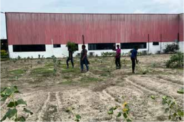
கேள்வி: நீங்கள் சொன்னீர்கள் இலங்கையில் மலையக மக்களைப் போலதான் மலேசியத் தமிழர்களும் ஒரே நிலை

அதிலிருந்து 40 வீதமான காய்கறிகளை பெற்றுக் கொள்ளக்கூடியதாக உள்ளது. அத்துடன், பிள்ளைகளே சமைக்கிறார்கள். அது மட்டுமல்ல எமது விளைநிலத்தில் முருங்கை மரம் உள்ளது. அதனை மருந்து விலகைகளை போல தயாரித்து விற்கிறோம். மஞ்சள் போன்றவற்றையும் பவுடராக்கி விற்பனை செய்கிறோம். இயற்கைப் பசளைகளை உற்பத்தி செய்து விற்பனை செய்கிறோம். அதன் ஊடாகக் கிடைக்கும் பணத்தை வைத்து இந்த அறவாரியத்தைத் தொடர்ந்து நடத்தலாம் என்று எண்ணியுள்ளோம்.