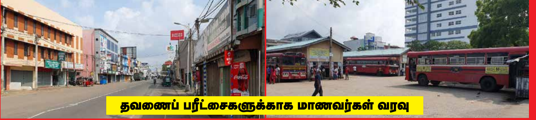
தவணைப் பரீட்சைகளுக்காக மாணவர்கள் வரவு

யாழ்ப்பாணம், ஒக்ரோபர் 20 தமிழ்க் கட்சிகளின் ஏற்பாட்டில் வடக்கு கிழக்கு மாகாணங்களில் இன்றைய தினம் முன்னெடுக்கப்படும் ஹர்த்தால் போராட்டத்திற்கு யாழ்ப்பாண நகரில் வர்த்தக நிலையங்கள் மூடப்பட்டு பூரண ஆதரவு வழங்கப்பட்டுள்ளது. இதனால், யாழ்ப்பாண நகரம் இயல்பு நிலையை இழந்திருந்தது.