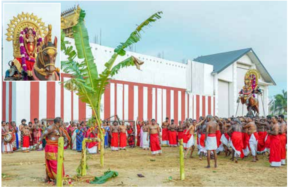
விஜயதசமி தினமான நேற்று நல்லூர் கந்தசுவாமி ஆலயத்தின் மாண்பு திருவிழாவின் காட்சி...