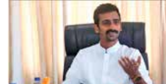
இதில் பெருந்தோட்ட மக்கள் உள்ளடங்கவில்லை.

ஆனால், நீர் வழங்கல் என்பது தேசிய நீர் வழங்கல் வடிகாலமைப்பு சபையின் கீழ் உள்ளடங்குகின்றது என்பதை அனைவரும் புரிந்து கொள்ள வேண்டும்.