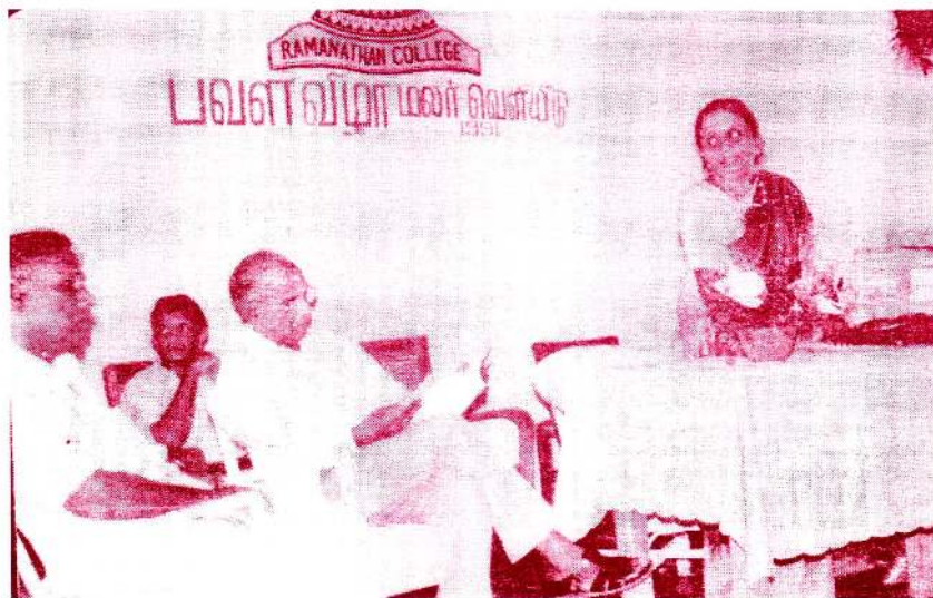
இராமநாதன் கல்லூர் 1991