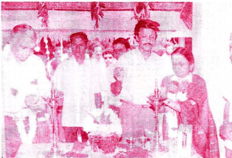
கோப்பாய் ஆசிரியர் பயிற்சிக் கல்லூரீப் பீர்ஷுசாரத்தீல் தம்பத்கள்