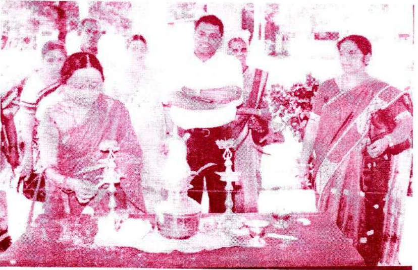
இராமநாதன் கல்லூர் வித்தக வெளியீடு