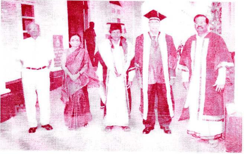
யாழ். பல்கலைக் கழக பட்டமளிப்பு விழாவில்