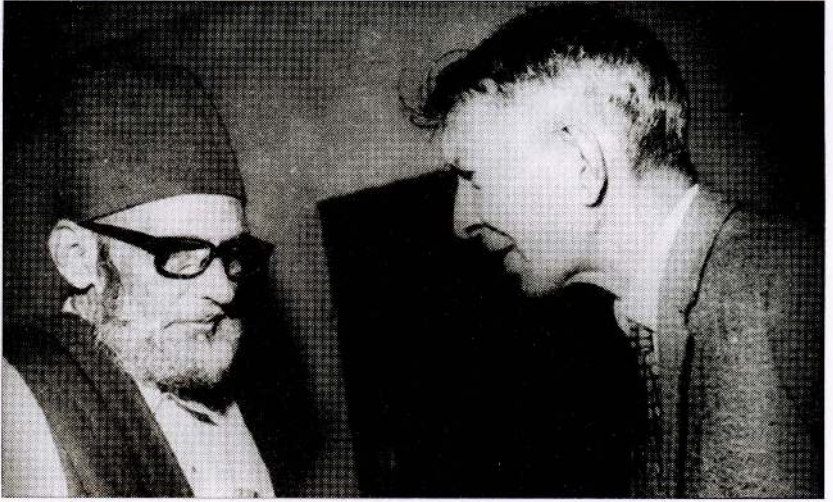
இந்திய முஸ்லிம் லீக்கின் தலைவர் காயிதே மில்லத்துடன் தந்தை செல்வா.