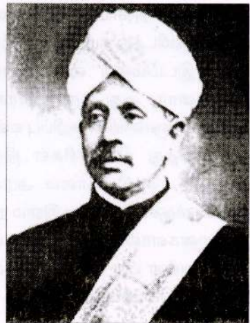
சேர். பொன். அருணாசலம்

பத்தொன்பதாம் நூற்றாண்டு முதலாக ஆற்றல் மிக்க தலைவர்கள் தமிழரிடையே தோன்றியுள்ளனர். அவர்களைச் சிறுமைப்படுத்துவதோ குறைகூறுவதோ இக்கட்டுரையின் நோக்கமன்று. ஒரு நூற்றாண்டுக் காலமாக இலங்கைத் தமிழரின் தலைமைத்துவம் ஒரு குடும்பத் தவர் வசமாக இருந்தது. அவர்கள் குமாரசுவாமி முதலியாரின் குடும்பத்தவர். அவர்களில் இரண்டாவது தலைமுறையில் வந்தவர் கு.முத்துக்குமாரசுவாமி. ஆங்கிலத்திலே தலை சிறந்த பேச்சாளர் சட்டவல்லுநர் பன்மொழிப் பண்டிதன்.