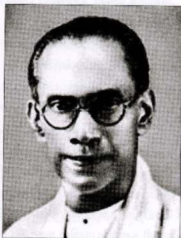
எஸ். டபிள்யூ.ஆர்.டி. பண்டாரநாயக்க

டபிள்யூ.ஆர்.டி. பண்டாரநாயக்கவும் அதற்கு ஆதரவாக இருந்தார். கொத்தலா வெல பிரதமாக விளங்கிய காலத்திலே பூர்வீலங்கா சுதந்திரக் கட்சிக்குச் சிங்கள மக்களிடையே ஆதரவு பெருகியது. சிங்களவரிடையிலே மரபு வழியாக வந்த சாதி உணர்வுகளைப் போக்கி ஒரு ஒருங்கிணைந்த தேசிய உணர்வினை பண்டாரநாயக்கவினால் ஏற்படுத்த முடிந்தது. மொழி, கலாசார மரபுகள் என்பனவே அவற்றின் அடையாளங்களாகும். அரசுகளும் மொழி பற்றிய கொள்கையிலே சடுதியான மாற்றம் ஏற்பட்டது.