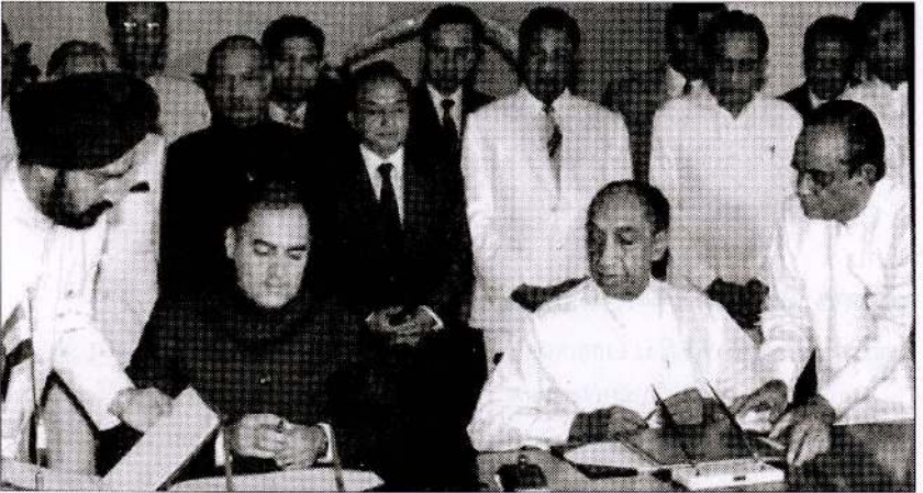
இலங்கை-இந்திய உடன்படிக்கை (1987) : இந்திய பிரதமர் ராஜீவ் காந்தி, இலங்கை ஜனாதிபதி ஜே.ஆர்.ஜயவர்தனா

இலங்கை - இந்திய உடன்படிக்கை (1987) மூலமே தமிழும் ஒரு ஆட்சி மொழி என்ற நிலை உருவானது. இது இன்றைய இளைஞர் சமுதாயம் புரிந்து கொள்ள முடியாத விடயமாகலாம். இன்றுள்ள பல்கலைக் கழகப் பட்டதாரி மாணவர்கள் அதற்குப் பிறகே பிறந்தவர்கள். அவர்களின் பெற்றோர்களும் இதனைப் புரிந்திருக்கமாட்டார்கள். அக்காலத்தில் ஊடகங்கள் இதனை விளக்கமாக விளம்பரப்படுத்த முடியவில்லை;