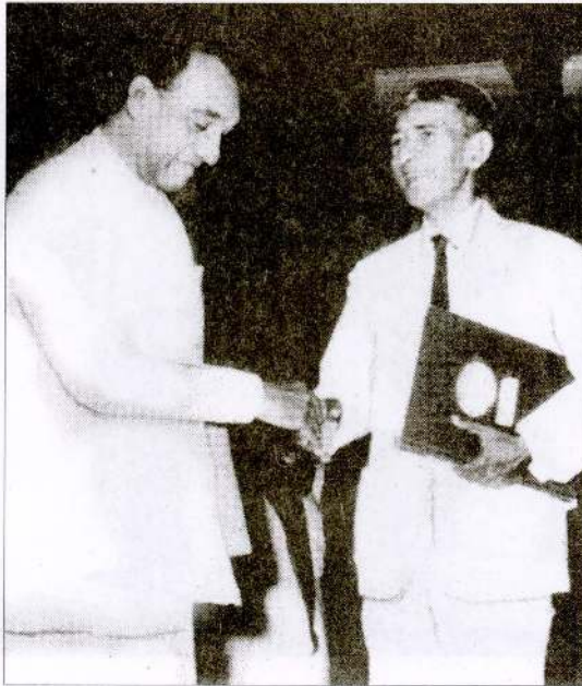
தந்தை செல்வாவுடன் கைகுலுக்கி மரியாதையை வெளிக்காட்டும் ஜனாதிபதி ஜே.ஆர்.ஜயவர்தன.