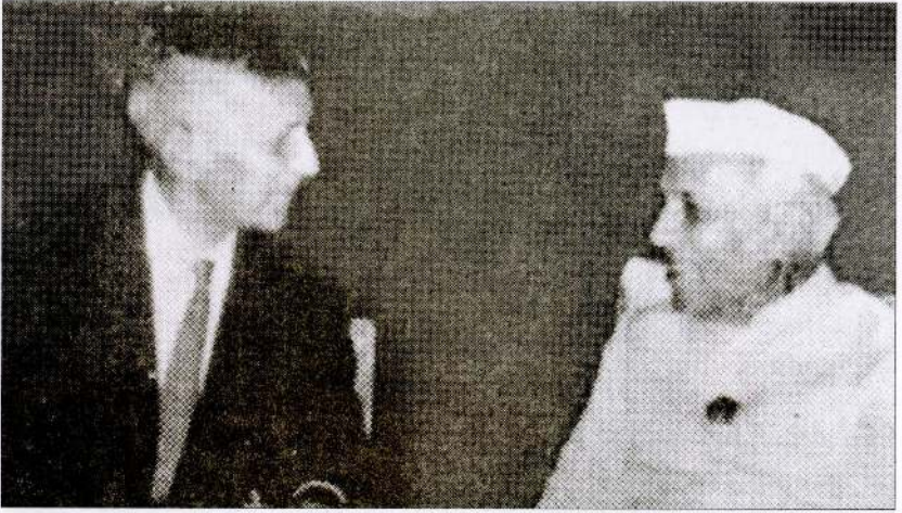
இந்தியப் பிரதமர் நேருவை தோழமையுடன் சந்தித்து உரையாடும் தந்தை செல்வா அவர்கள்.