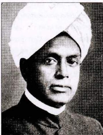
சேர். பொன். இராமநாதன்

“டொனமூர் அரசியல் யாப்பினை ஒப்புக் கொள்ளுமிடத்து தமிழருக்கு இனிமேல் இங்கு இடமில்லை” என்று இராமநாதன் சொன்னார். அது ஒரு முதிர்ச்சியான அரசியல் ஞானியின் குறிப்பு என்பதைப் பிற்காலத்து நிகழ்ச்சிகள் நிரூபித்து விட்டன. நெடுங்காலம் அரசியலிற் செல்வாக்குச் செலுத்திய இராம நாதனின் சாதனைகளால் அவர் மீது தமிழரும் நாட்டிலுள்ள பிற சமூகத்தினரும் பெருமதிப்புக் கொண்டிருந்தனர்.