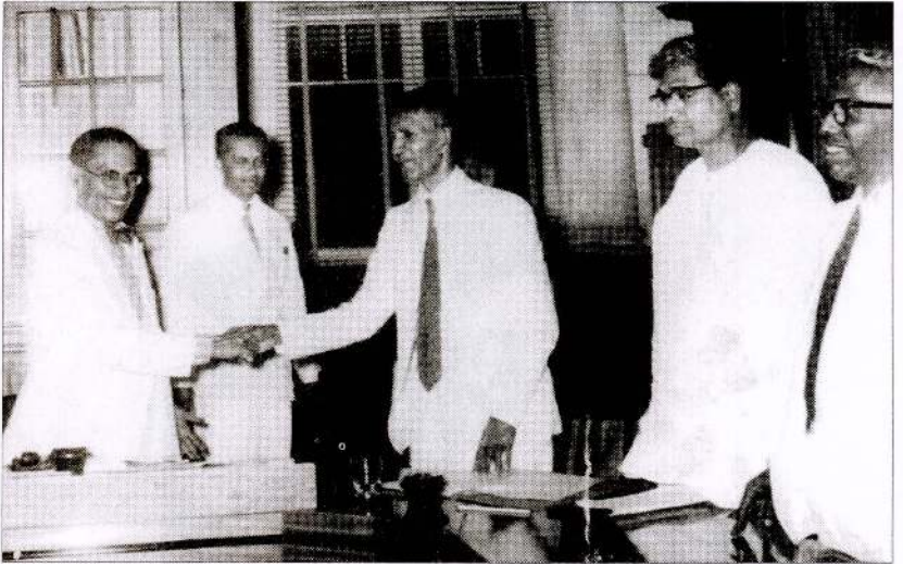
பண்டா-செல்வா ஒப்பந்தம் கைச்சாத்திட்டப் போது....