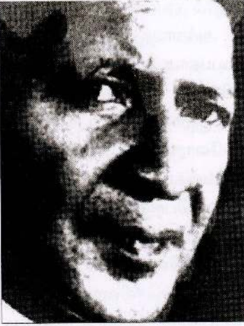
எஸ். ஜே. வி. செல்வநாயகம்

எஸ். ஜே. வி. செல்வநாயகத்தின் வாழ்க்கை வரலாறும் அரசியல் நெறியும் 20ஆம் நூற்றாண்டின் முற்காலப் பகுதியில் இலங்கையில் இடம்பெற்ற நிகழ்ச்சிகளையும் மாற்றங்களையும் பின்னணியாகக் கொண்டவை. எனவே அவரைப் பற்றிய இந்தக் கட்டுரையில், அந்தப் பின்னணியைச் சுருக்கமாக விளக்குவது அவசியமாகின்றது.