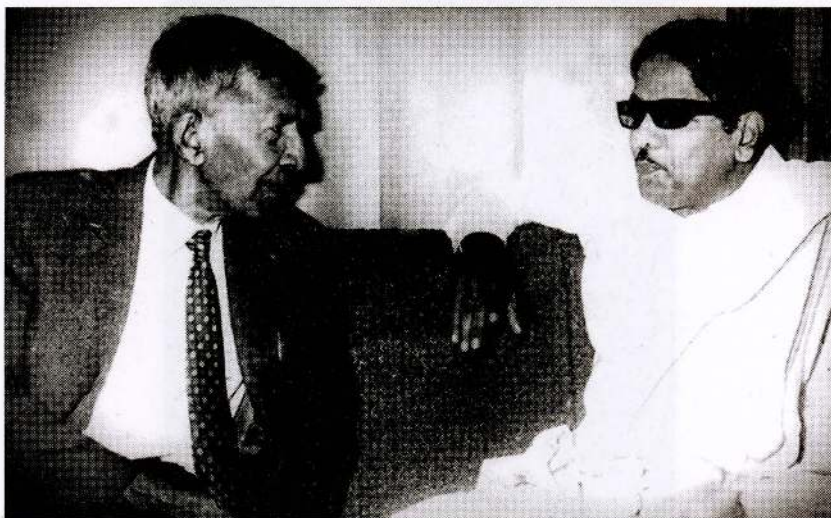
கலைஞர் கருணாநிதியுடன் உரையாடும் தந்தை செல்வா