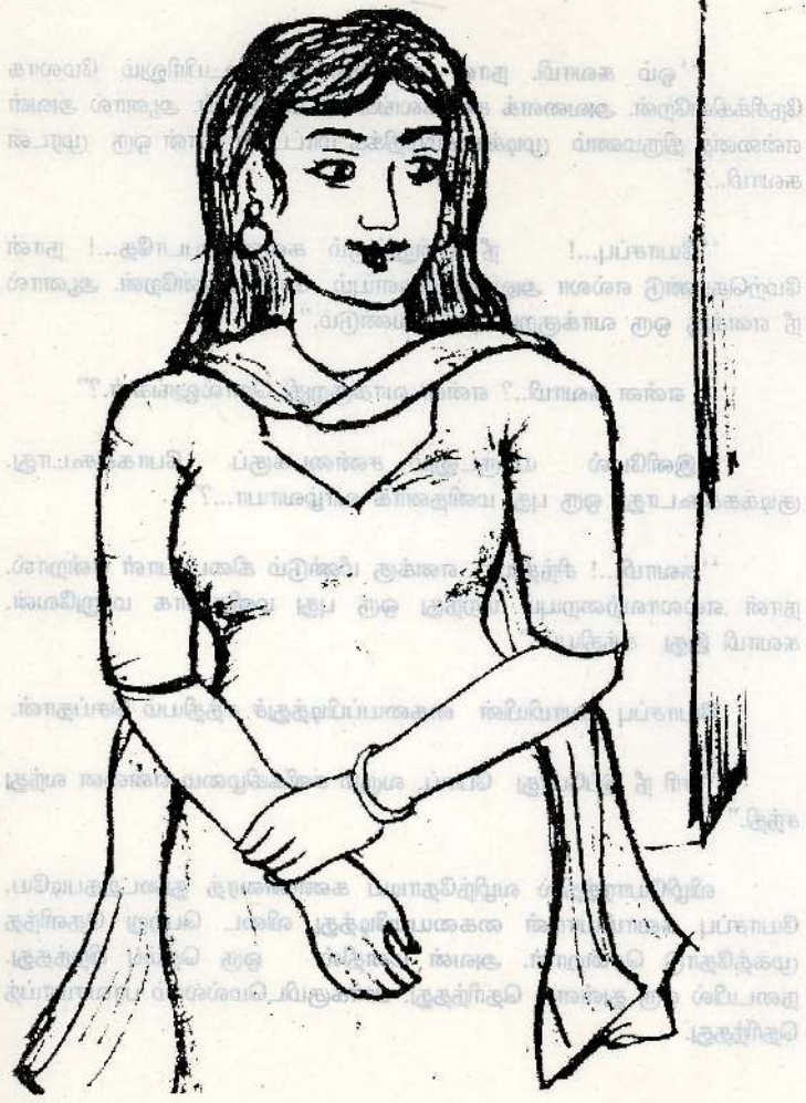
1991 திபட்டா / இலது / ஓது ( கதைக்கு இணைமாக ) நாது