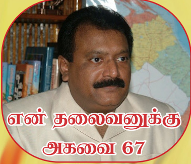
என் தலைவனுக்கு அகவை 67

“இலட்சிய வோங்கைகள் இறப்பதுமில்லை விடுதலையுலிகள் வீழ்வதுமில்லை”