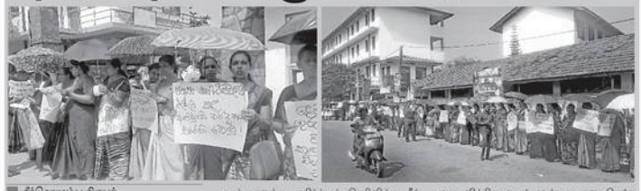
நீர்கொழும்பு பகுதியில் ஆசிரியர்களை தாக்குதலுக்கு உள்ளாக்கியதற்கு எதிராக நீர்கொழும்பில் ஆசிரியர்கள் வெள்ளக்கிழமை அப்பொழுதில் காட்டினார்கள். நீர்கொழும்பு துறைமுகத்தின் மீது தாக்குதலுக்கு உள்ளாக்கியதற்கு எதிராக நீர்கொழும்பில் ஆசிரியர்கள் வெள்ளக்கிழமை அப்பொழுதில் காட்டினார்கள்.