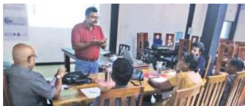
(புத்தளம் தினகரன் நிருபர்)

புத்தளம் மாவட்ட ஊடகவியலாளர்களை தெளிவுபடுத்தும் செயலமர்வு