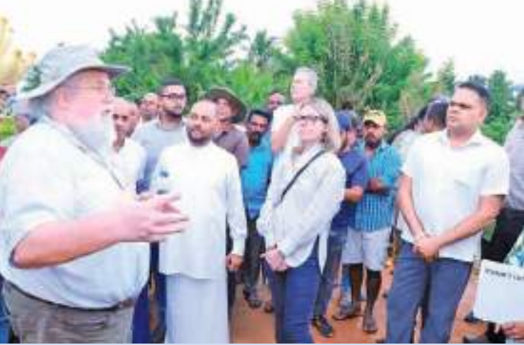
அநுராதபுரம் மேற்கு தினகரன் நிருபர்