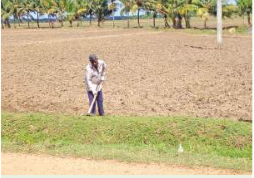
அம்பாறை மாவட்டத்திலுள்ள சவளக்கடை விவசாயக்கண்டத்தில் தற்போது பெரும் போக ஆரம்பவேலைகள் இடம்பெறுவதை படத்தில் காணலாம்.