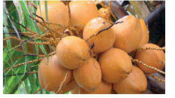
தெங்கு அபிவிருத்தி சபை, இலங்கை தென்னை ஆராய்ச்சி நிறுவனம் மற்றும் தெங்கு அபிவிருத்தி

நாட்டில் செவ்விரைநாளை கேள்வி சர்வதேச சந்தையில் வேகமாக அதிகரித்து வருவதுடன், 2023ஆம் ஆண்டில் செவ்விரைநாள் ஏற்றுமதி 117 சதவீதத்தால் அதிகரித்துள்ளதாக இலங்கை தேங்கு அபிவிருத்தி அதிகார சபை தெரிவித்துள்ளது. விவசாயம் மற்றும் பெருந்தோட்ட கைத்தொழில் அமைச்சர் மகிந்த அமரவீர