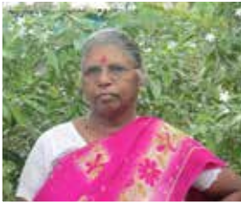
- தமிழ்க்கவி -

எந்தப்பொருளை உற்பத்தி செய்தாலும் அந்தப்பொருளைச் சந்தைப்படுத்த வேண்டும். சந்தைப்படுத்த முடியாது போனால் அது முதலுக்கே மோசமாகிவிடும். எனவே உற்பத்தி செய்யும் பொருள் மக்களுக்கு தேவையானதாக இருக்க வேண்டும் அன்றாடம் செலவிடும் பொருளாகவும் இருக்க வேண்டும்.