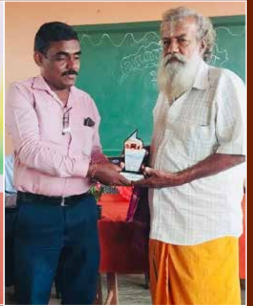
இந்தக் குடி தண்ணீர் செயற்றிட்டத்தை ஆரம்பித்து வைத்தார்.