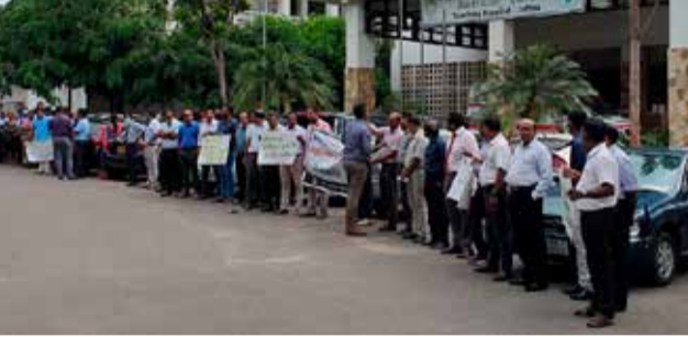
யாழ்ப்பாணம், நவ. 04 வடக்கு மாகாணத்தில் உள்ள வைத்தியசாலை