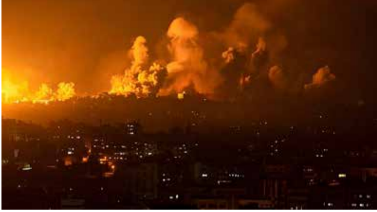
கூறியுள்ளது. இதனால் இஸ்ரேல் தாக்குதலின் தீவிரம் மேலும் அதிகரிக்கலாம் என்று தெரிகிறது.

இந்நிலையில் காஸா நகரம் முழுவதையும் சுற்றி வளைத்துள்ளதாக இஸ்ரேல் ராணுவம்