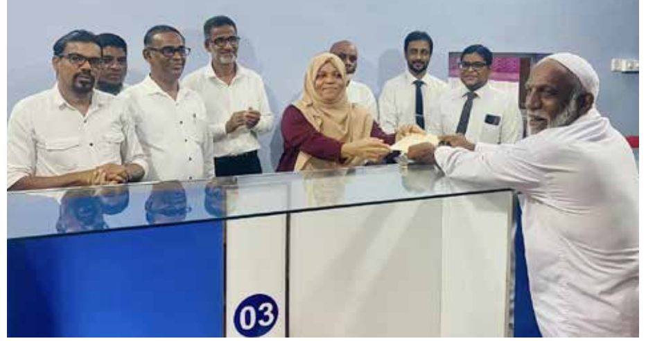
மஹாபொல உதவித் தொகை போன்ற பல சேவைகளை பொதுமக்கள் சேவை

பரீட்சை கட்டணங்கள் செலுத்துதல், பிறப்பு, இறப்பு, திருமண சான்றிதழ்கள் தொடர்பான சேவைகள், வாகன அனுமதிப் பத்திரம் வழங்கல், வாகன உரிமை மாற்றம், வருமானச் சான்றிதழ், கால்நடைகள், போக்குவரத்து அனுமதிப் பத்திரம்,