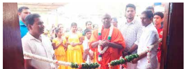
னிலையில் கட்டடம் திறந்து வைக்கப்பட்டது.