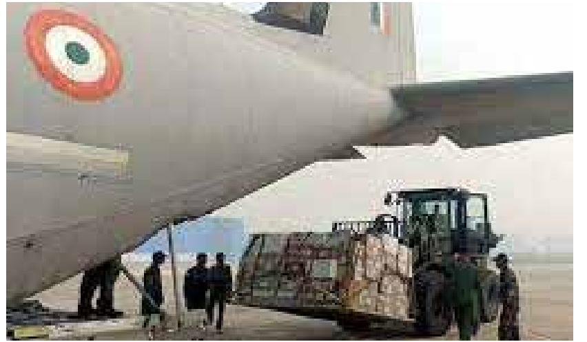
என குறிப்பிட்டுள்ளார். (04)

"அண்டை நாடுகளுக்கு முதலில் உதவ வேண்டும் என்ற கொள்கையை பிரதமர் மோடி வலியுறுத்தி வருகிறார். அதன்படி நெருக்கடி நேரத்தில், அண்டை நாடுகளுக்கு உதவுவதில் இந்தியா உறுதியுடன் உள்ளது"