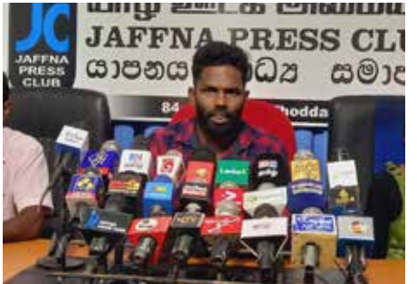
இடம்பெற்ற ஊடகவியலாளர் சந்திப்பின் போதே அவர் இவ்வாறு தெரிவித்தார். 2