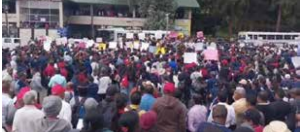
நுவரெலியா தபால் நிலையத்தை வெளிநாட்டு நிறுவனத்திற்கு விற்பனை செய்யும் நடவடிக்கைக்கு

எதிர்ப்புத் தெரிவித்து பாரிய போராட்டமொன்று முன்னெடுக்கப்பட்டது.