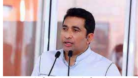
சுதந்திர சதுக்கத்திலுள்ள அரசு வங்கியிலுள்ள 2 மில்லியன் டொலர் பணத்தையே இவ்வாறு பெற்றுக்கொள்ள முயற்சித்து வருவதாகவும் அமைச்சர்

இலங்கை வங்கியின் கிரிக்கெட் சங்கக் கணக்கிலிருந்து 2 மில்லியன் டொலர் பணத்தை ஸ்ரீலங்கா கிரிக்கெட் அதிகாரிகள் மீள்பெற்றுக்கொள்வதற்கான முயற்சிகளில் ஈடுபட்டு வருகின்றமை தொடர்பில் தகவல் கிடைத்துள்ளதாக விளையாட்டுத்துறை அமைச்சர் ரொஷான் ரணசிங்க தெரிவித்துள்ளார்.