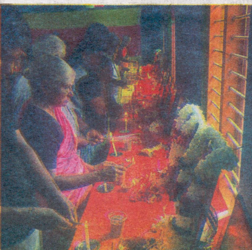
வடமராட்சி சப்பர்மடம் கிராமத்திலுள்ள மாவீரர்களின் பெற்றோருக்கு கிராமமக்கள் அமைப்புக்களின் ஏற்பாட்டில் கௌரவிப்பு நிகழ்வு அண்மையில் முன்னெடுக்கப்பட்டது. அத்துடன் மாவீரர்களுக்கு அஞ்சலியும் செலுத்தப்பட்டது. (ச-27)

தாயகம் மற்றும் புலம்பெயர்ந்தோர் நினைவேந்தல் ஏற்பாட்டுக்கு முன்னிட்டு முன்வழக்கையில் இந்த நிகழ்வு இடம்பெற்றது. நிகழ்வில் வடமாகாண சபை முன்னாள் உறுப்பினர்கள், பிரதேச சபை உறுப்பினர்கள், சமூகச் செயற்பாட்டாளர்கள் எனப் பலர் கலந்துகொண்டனர். மாவீரர்களின் பெற்றோருக்கு மாவீரர்கள் நினைவாக தென்னங்கன்றுகளும் கையளிக்கப்பட்டன. (ச-19)