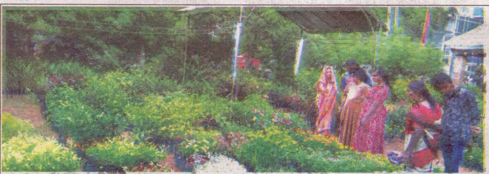
வடமாகாண மரநடுகை மாதத்தை முன்னிட்டு தமிழ்த் தேசியப் பசுமை இயக்கம் தாவர உற்பத்தியாளர்களுடன் இணைந்து நடத்தும் "கார்த்திகை வாசம்" மலர்க் கண்காட்சி நேற்று நல்லூர் சங்கிலியன் பூங்காவில் ஆரம்பமானது. (எ-66)

அடுத்த ஆண்டு ஜனாதிபதி மற்றும் பொதுத்தேர்தல் என்பன நிச்சயமாக நடத்தப்படும். நாம் தோர்தலுக்கு அஞ்சவில்லை. தேர்தல்கள் எக்காரணத்துக்காகவும் பிற்போடப்படமாட்டாது என்று ஜனாதிபதி ரணில் விக்கிரமசிங்க நாடாளுமன்றத்தில் நேற்றுத் தெரிவித்தார். >>>11