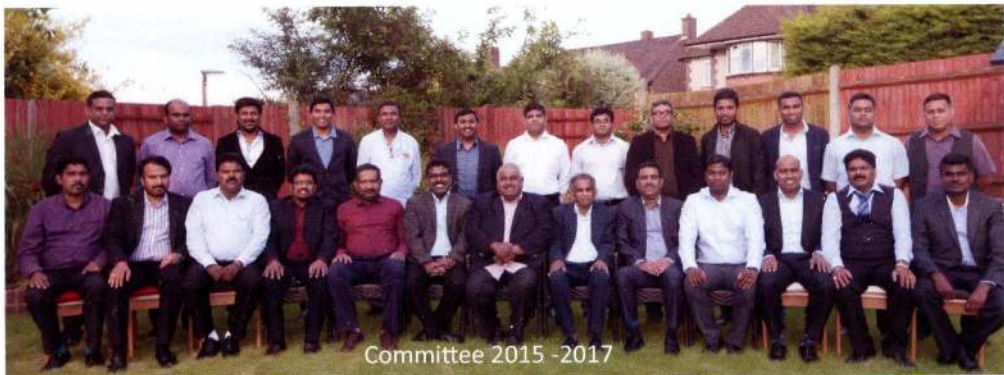
Committee 2015 -2017