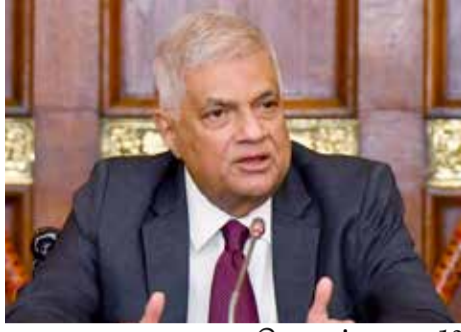
கொழும்பு, நவ. 12

உலகெங்கும் உள்ள இந்து மக்களினால் கொண்டாடப்படும் தீபாவளி பண்டிகையில் எமது மனத்துள்ளே இருக்கும் தீய எண்ணணங்களை நீக்கி ஒளியை உதயமாக்கும் என ஜனாதிபதி ரணில் விக்கரமசிங்க தெரிவித்துள்ளார்.