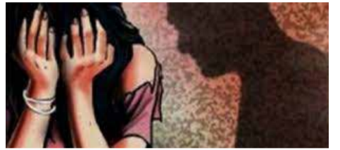
கொழும்பு, நவ. 12

நாடு முழுவதும் ஓக்ரோபர் மாதத்தில் சிறார் பலாத்கார வழக்குகளின் அதிர்ச்சியூட்டும் அளவில் அதிகரித்துள்ளது.