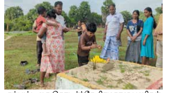
தப்பட்டதை தொடர்ந்தே சிரமதான பணிகள் முன்னெடுக்கப்பட்டன. (அ)

முன்னதாக மாவீரர்களுக்கு ஈக்சூடர் ஏற்றி அகவணக்கம் செலுத்தி மலர்வணக்கம் செலுத்