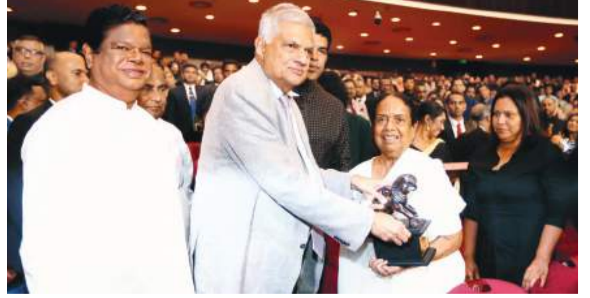
ஜனாதிபதி திரைப்பட விருது வழங்கும் விழா ஜனாதிபதி ரணில் விக்கிரமசிங்கவின் தலைமையில் நேற்று கொழும்பு தாமரைத் தடாகம் அரங்கில் நடைபெற்றது. ஜனாதிபதி பிரபல படகி நந்தா மாலினிக்கு விசேட விருதொன்றை வழங்குவதை படத்தில் காணலாம். ஊடகத்துறை அமைச்சர் பந்துல குணவர்தனவும் அருகில் காணப்படுகிறார்.