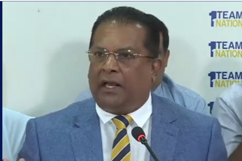
பல விவாதங்கள் மற்றும் ஆலோசனைகளுக்கு பிறகுதான் U 19 கிரிக்கெட் உலகக் கிண்ணம்,