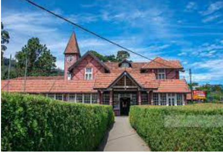
(06ஆம் பக்கத் தொடர்ச்சி)

நுவரெலியா பிரதான தபால்நிலையத்தை விற்பனை செய்வது குறித்து அரசாங்கம் சிந்தித்துள்ளது. இது விவாதத்தையும் சர்ச்சையையும் ஏற்படுத்தியுள்ளது. சிலர் வருவாயைப் பெறுவதற்கு அவசியமான நடவடிக்கையாகக் கருதுகின்றனர். மற்றவர்கள் தபால் அலுவலகத்தின் வரலாற்று மற்றும் கலாச்சார முக்கியத்துவம் எந்தவொரு சாத்தியமான நிதி ஆதாயத்தையும் விட அதிகமாக உள்ளது என்று வாதிடுகின்றனர்.