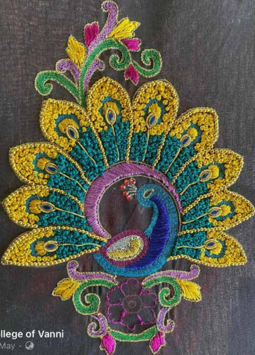
College of Vanni 12 May

எின் உதவியுடன் இதனைக் கற்று வெளியேறியுள்ளார்கள்.