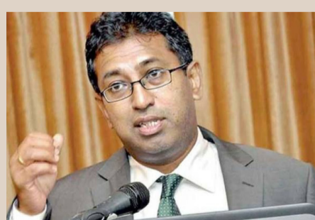
வரி அறவிடப்படாத 100 பொருட்களுக்கு வரி அறவிடப்போகின்றனர். தொலைபேசி, கணினி, அனைத்து மின்சாதனப் பொருட்களுக்கும் வரி

படவுள்ளது. குறித்த வரவு செலவுத் திட்டத்தில் அரச ஊழியர்களின் சம்பளத்தை அதிகரிப்பதற்காக ஜனாதிபதி 133 பில்லியன் ரூபாய் நிதியை ஒதுக்கியுள்ளார். இதேவேளை, புதிய வரிகள் ஊடாக 800 பில்லியன் ரூபாயை அறவிட திட்டமிடப்பட்டுள்ளது. உதாரணமாக சம்பளம் 100 ரூபா அதிகரிக்குமாயின் வரி 600 ரூபாயாக அதிகரிக்கும்.