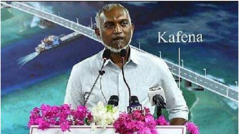
முகமது மூயிஸ் தெரிவித்துள்ளார்.

களுக்கு இடையே கடும் போட்டி நடந்த நிலையில் இந்தியாவுக்கு ஆதரவாளராக அறியப்படும் முகமது சோலீ தோல்வி அடைந்தார். இதனை அடுத்து சீனாவுக்கு ஆதரவாக கருதப்படும் முகமது மூயிஸ் புதிய ஜனாதிபதியாக அறிவிக்கப்பட்டுள்ள நிலை