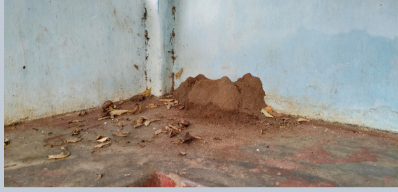
மிக நீண்டகாலமாக கவனிப்பாரற்ற நிலைமையில் சுத்தம் செய்யப்படாது காட்சியளிக்கின்றது. தற்போது மழைக்காலம் என்பதால், பஸ் தரிப்பிடத்தில் மழைக்கு ஒதுங்க முடியாத நிலை உள்ளது.

மக்கள் தங்களின் அன்றாடத் தேவைகளை நிவர்த்தி செய்வதற்காக திருகோணமலை, புல்மோட்டை ஆகிய நகரங்களுக்குச் செல்லும் பிரயாணிகளும் அரச ஊழியர்களும் பஸ்ஸைக் காக தங்கி நின்று செல்ல முடியாததொரு துர்ப்பாக்கிய நிலை காணப்படுகிறது. குச்சுவெளி பிரதேச சபைக்கு அறிவித்தும் அதைக் கண்டும் காணாமல்