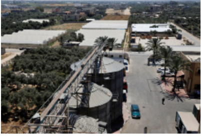
கப்பட்டதாக ஐ.நா மனிதாபிமான விவகாரங்களுக்கான ஒருங்கிணைப்பு அலுவலகம் (OCHA) தெரிவித்துள்ளது.

காலாவில் எஞ்சியிருந்த டெய்ர் அல் பலாவில் உள்ள அஸ் சலாம் மில் நள்ளிரவு நேரத்தில் தாக்கப்பட்டதாக ஐ.நா மனிதாபிமான விவகாரங்களுக்கான ஒருங்கிணைப்பு அலுவலகம் (OCHA) தெரிவித்துள்ளது. காலாவில் கடைசியாக செயல்படும் ஆலை இதுவாகும்.