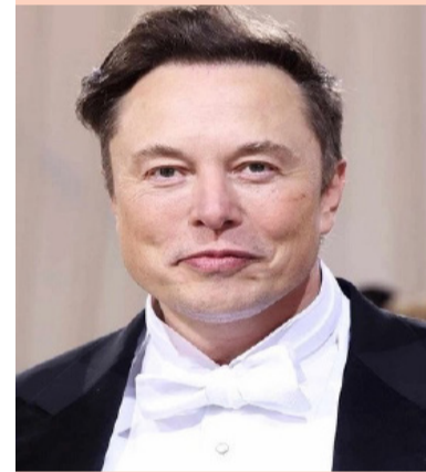
தாளர் வால்டர் ஐசக்சன் புத்தகமாக எழுதி வெளியிட்டார். இந்தப் புத்தகம் பரவலான கவனத்தைப்

பெற்ற நிலையில் இப்போது அந்தப் புத்தகத்தை மையப்படுத்தி திரைப்படம் உருவாக உள்ளது. இந்தத் திரைப்படத்தை ஹாலிவுட் இயக்குநரான டேரன் அரோனோஃப்ஸ்கி