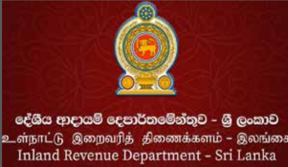
දේශීය ආදායම් දෙපාර්තමේන්තුව - ශ්‍රී ලංකාව உள்நாட்டு இறைவரித் திணைக்களம் - இலங்கை Inland Revenue Department - Sri Lanka

தற்போது சுமார் 13,000 நிறுவனங்கள் பெறுமதி சேர் வரி செலுத்து