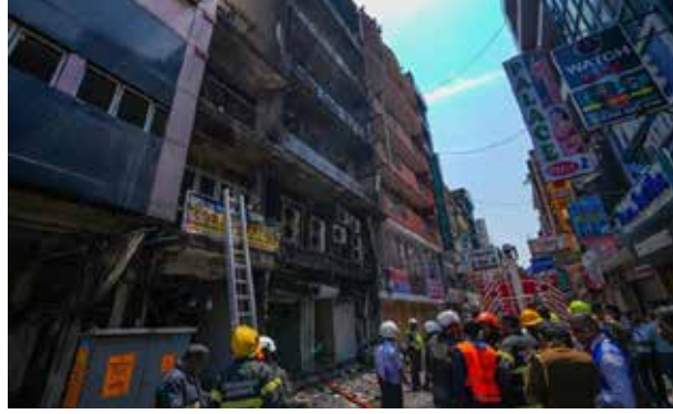
க்கடியின் காரணமாக பாரிய ஆபத்து நிகழ்ந்துள்ளமை தெரிய வந்துள்ளதையடுத்தே இந்த கணக்கெடுப்பு

அண்மையில் கொழும்பு குறுக்குத் தெருவில் உள்ள கட்டடமொன்று தீப்பிடித்ததில் ஊழியர்கள் ஒற்றைக் கதவின் வழியே வெளியேறும்போது ஏற்பட்ட நெரு-