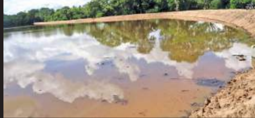
(அநுராதபுரம் மேற்கு தினகரன் நிருபர்)

கஷ்டக்கல்விக்கிய பிரதேச செயலக பகுதிக்குட்பட்ட அம்பக ஹவெல கிராம அலுவலகப் பிரதேசத்தில் கோவ்வெல கமநல சேவை மத்திய நிலையத்தின் கீழ் செயல்படுத்தப்பட்டுவரும் தம்பலகொல்ல குளம் 'சுறாறு' செயற்கைத் திட்டம் மூலம் புனரமைப்பு பணிகள் ஆரம்பிக்கப்பட்ட போதும் தற்போது அதன் அபிவிருத்தி பணிகள் இடைநிறுவில் கைவிடப்பட்டுள்ளதனால் இம்முறை பெரும்போக நெற் செய்கையினை மேற்கொள்ள முடியாமல் 150 க்கும் மேற்பட்ட விவசாய குடும்பங்கள் பல சிரமங்களை எதிர்கொண்டுள்ளதாக விவசாயிகள் தெரிவித்தனர்.