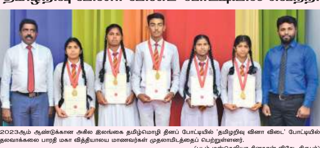
2023ஆம் ஆண்டுக்கான அகில இலங்கை தமிழ்மொழி திண்போட்டியில் 'தமிழறிவு வினா விடை' போட்டியில் தலவாக்கலை பாரதி மகா வித்தியாலய மாணவர்கள் முதலாமிடத்தைப் பெற்றுள்ளனர்.