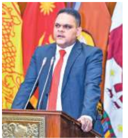
காலத்தில் பொருளாதார நெருக்கடியில் இருந்து விடுபட சரியான பாதையில் பயணித்த நாடாக இலங்கை மாற்றமடைந்துள்ளது. இந்தப் பொருளாதாரத்தை மீண்டும் நல்ல நிலைக்கு கொண்டு வருவது என்பது அரசியல் கோணத்தில் பார்க்க வேண்டிய ஒரு விடயமல்ல. ஜனாதிபதி உள்ளிட்ட அரசாங்கம் பிரபலமான தீர்மானங்களை எடுக்கவில்லை. அரசாங்கம் மக்கள் மத்தியில் பிரபலமடையக் கூடிய தீர்மானங்களை எடுத்திருந்தால், இந்த நாட்டின் நிலைமை 2022ஆம் ஆண்டுக்கு முன்னர் இருந்ததை விட இன்னும் மோசமாக இருந்திருக்கும்.

அதற்காக ஜனாதிபதி ரணில் விக்கிரமசிங்க மிகுந்த உறுதியுடன் தலைமைத்துவத்தை வழங்கியுள்ளார். அவரின் தலைமைத்துவத்துக்கு இந்த நாட்டு மக்கள் ஆதரவளித்துள்ளனர். நாட்டின் பொருளாதாரம் வீழ்ச்சியடைந்த முதல் நாடு இலங்கை மட்டுமல்ல. ஆனால் குறுகிய