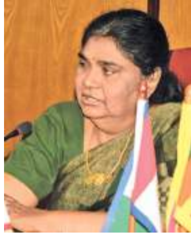
அதிகாரிகள், விசேடமாக மாணவிகளின் சுகாதார நிலைமை, மாத விடாய் சிக்கல் உள்ளிட்டவை தொடர்பாக கவனம் செலுத்தப்பட வேண்டுமென்று தெரிவித்தனர்.

இதேவேளை, மாணவர்களின் சுகாதார நிலைமை தொடர்பாக கவலை தெரிவித்த வடமாகாண சுகாதார அமைச்சு