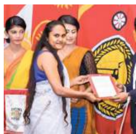
பினர்களுக்கு வழங்கப்பட்டது. இங்கு கருத்துத் தெரிவித்த நிதி இராஜாங்க அமைச்சர் ஷெஹான் சேமசிங்க, "பிரபலமான தீர்மானங்களை எடுத்து நாட்டின் பொருளாதாரத்தை மீண்டும் வீழ்ச்சியடைந்த யுகத்திற்கு கொண்டு செல்லும் அவசியம் அரசாங்கத்திற்கு கிடையாது" என்று தெரிவித்தார்.

இளைஞர் பாராளுமன்ற சபாநாயகருடன் இணைந்து படைக்கள சேவித்த செங்கோலை எடுத்து சபைக்குள் பிரவேசித்த பின்னர், இலங்கை இளைஞர் பாராளுமன்றத்தின் ஐந்தாவது அமர்வு ஆரம்ப