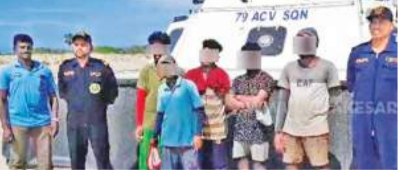
இருச்சி எம்.கே. ஷாகுல் ஹமீது

தனுஷ்கோடி அருகே எல்லையை தாண்டிய இலங்கை மீனவர்கள் 05 பேர் கைது செய்யப்பட்டனர்.