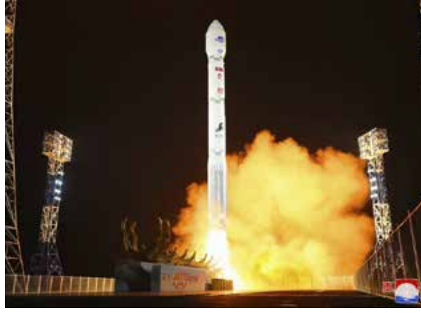
செலுத்த இருப்பதாக வடகொரியா தெரிவித்திருந்தது. ஆனால், எந்தக் காரணமும் தெரிவிக்கப்படாமல் அந்த முயற்சியைக் கைவிட்டது. இப்போது மீண்டும் உளவுச் செயற்கைக்கோளைச் செலுத்த இருப்பதாக அறிவித்துள்ளது.

இந்நிலையில், மூன்றாவது முறையாக கடந்த ஓக் டோபரில் உளவுச் செயற்கைக்கோளைச்