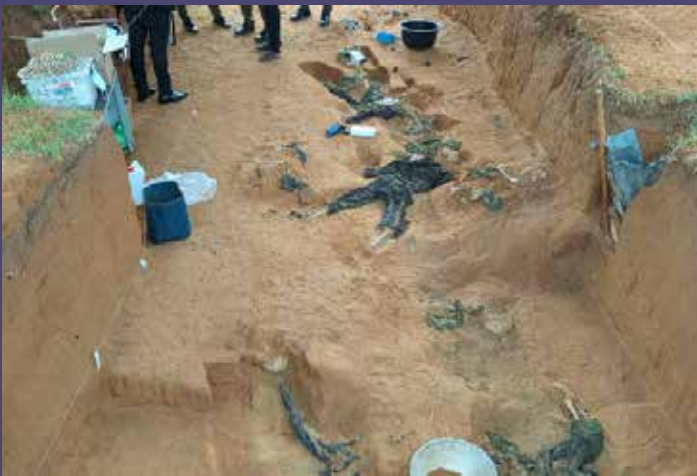
நேற்றையதினம் அகழ்வாய்வு நிறைவடையும்போது ஒரு மனித