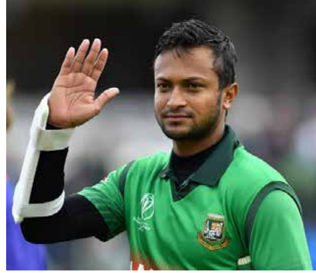
இந்த நாடாளுமன்றத் தேர்தலை பிரதான எதிர்க்கட்சிகள் புறக்கணிப்பதாக அறிவித்துள்ள நிலையில், தொடர்ந்து நான்காவது முறையாக அவமி லீக் வெற்றி பெற்று ஆட்சி அமைக்கவுள்ளதாக எதிர்பார்க்கப்படுகிறது. (04)

ஷகிப் அல் ஹசனின் சொந்த ஊரான மகுரா, பங்களாதேஷ் தலைநகரான டாக்கா உள்ளிட்ட 3 தொகுதிகளில் அவர் போட்டியிடுவார் என்று எதிர்பார்க்கப்படுகிறது.