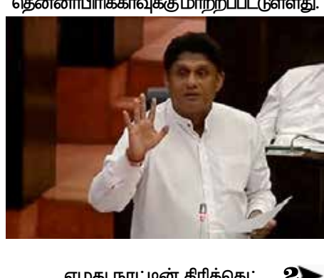
எமது நாட்டின் கிரிக்கெட்

இலங்கையில் நடைபெறவிருந்த 19 வயதுக்குட்பட்டவர்களுக்கான உலகக் கிண்ணக் கிரிக்கெட் தொடர், தென்னாபிரிக்காவுக்கு மாற்றப்பட்ட விவகாரம் தொடர்பாக ஐ.சி.சி.யிடமும் இலங்கை கிரிக்கெட் சபையிடமும் ஜனாதிபதி உரிய விளக்கத்தைக் கோர வேண்டும், என எதிர்க்கட்சித் தலைவர் சஜித் பிரேமதாஸ வலியுறுத்தியுள்ளார். நாடாளுமன்றில் இன்று உரையாற்றிய அவர், இலங்கையில் நடைபெறவிருந்த 19 வயதுக்குட்பட்டவர்களுக்கான உலகக்கிண்ணக் கிரிக்கெட் தொடர்,