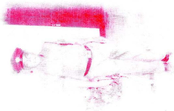
காதலி சிந்த ஆயுள்மீத பக்ககலைக்கறகத்தில் மேலவையில் இருந்தபோது அமரர் அவர்கள்