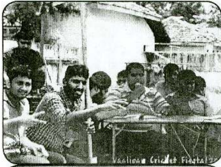
Vaaliam Cricket Fiesta