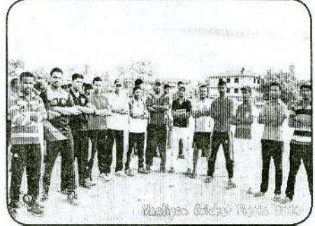
Vaaliam Cricket Fiesta 2014