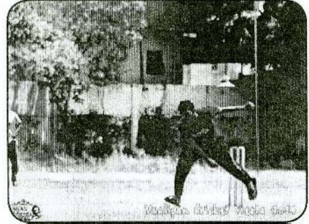
Vaaliam Cricket Fiesta 2014