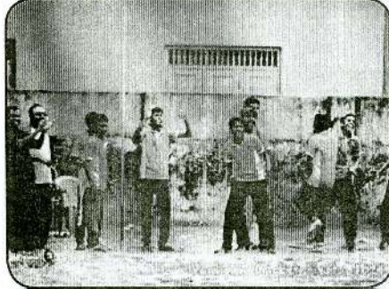
Vaaliam Cricket Fiesta 2014