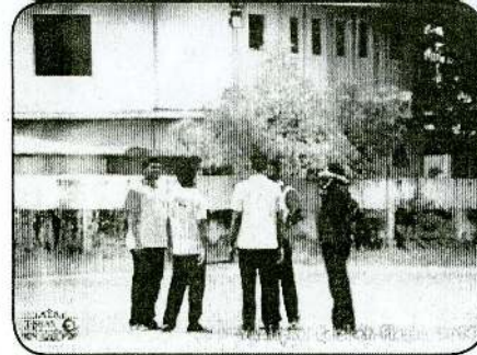
Vaaliam Cricket Fiesta 2014