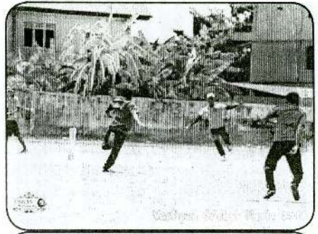
Vaaliam Cricket Fiesta 2014