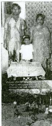
Some historical sketches.....

வாழ்கின்றனர். 1980ம் ஆண்டு திருப்பேரவை அன்னாரின் திட்டத்தினையும் அதன் முன்னேற்றத்தினையும் அங்கீகரித்து ஜீவோதயத்தை இலங்கை மெதடிஸ்த திருச்சபையின் ஓர் முன்னோடி விவசாயத்திட்டமாக ஏற்றுக் கொண்டது. ஐந்து வருடங்களுக்கு இப்பணிக்கென அன்னார் பிரத்தியேகப் படுத்தப்பட்டு பண்ணையின் முகாமையாளராகவும் திருப்பணியாளராகவும் நியமிக்கப்பட்டார்.