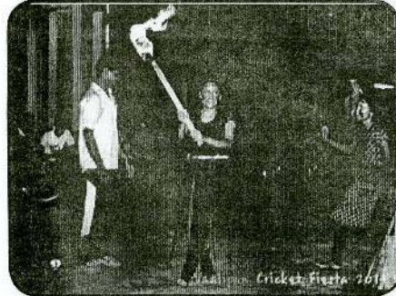
Vaaliam Cricket Fiesta 2014