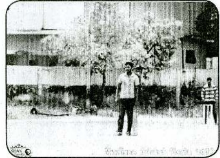
Vaaliam Cricket Fiesta 2014