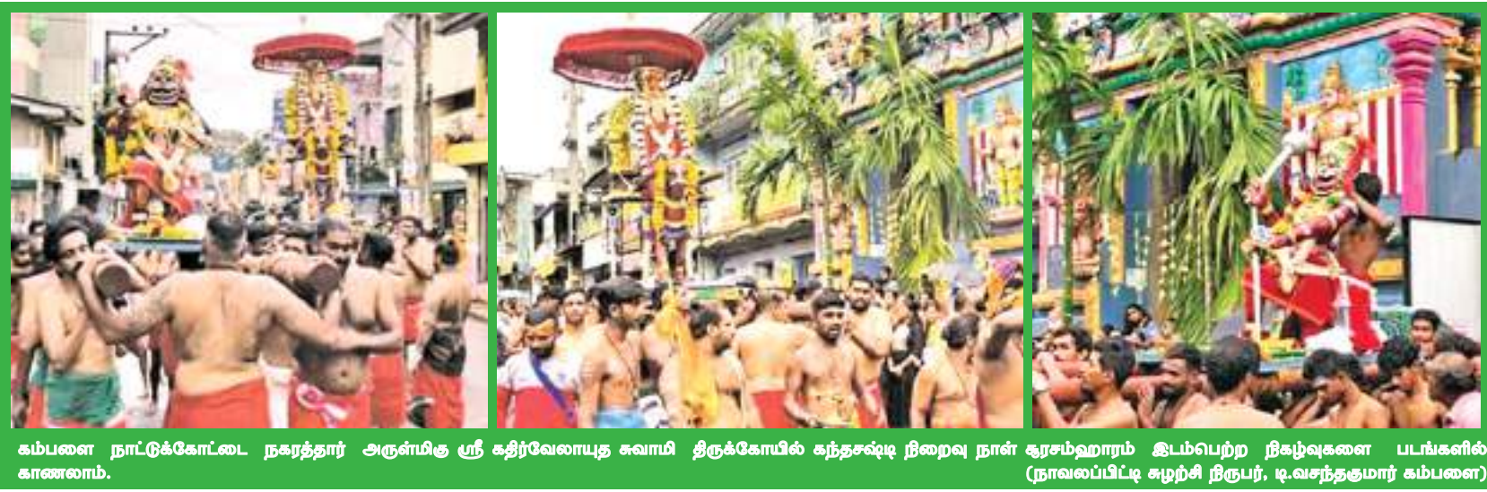
கம்பளை நாட்டுக்கோட்டை நகரத்தார் அருள்மிகு ஸ்ரீ கதிர்வேலாயுத சுவாமி திருக்கோயில் கந்தசஷ்டி நிறைவு நாள் ஐசுவரமூர்த்தம் கிடம்பெற்ற நிகழ்வுகளை படங்களில் காணலாம்.