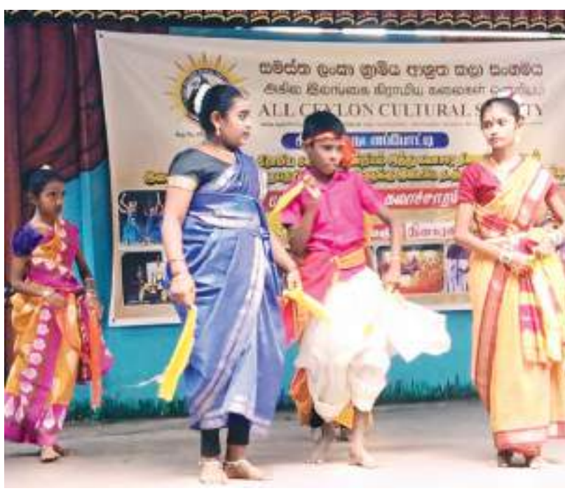
ஆடற்கலைப் போட்டியில் கலந்து கொண்ட கந்தாணை புதுகம ஸ்ரீ முத்துமாரியம்மன் அறநெறிப் பாடசாலையின் மாணவ, மாணவிகள்.

அகில இலங்கை கிராமிய கலைகள் ஒன்றியம் இந்து கலாசார திணைக்களத்துடன் இணைந்து நடத்தும் ஆடற்கலைப் போட்டி நேற்று ஆரம்பமானது. நேற்றைய போட்டி கொழும்பு, கொட்டாக்கு சேனை இந்து மகா வித்தியாலயத்தில் நடைபெற்றது. இதில் கம்பஹா மாவட்ட அறநெறிப் பாடசாலைகள் பங்குபற்றின. இந்தப் போட்டியில் வத்தளை ஸ்ரீசுரிகிரீசன் ஐயப்ப அறநெறிப் பாடசாலை வெற்றிப் பெற்று இறுதிச் சுற்றுப் போட்டிக்கு தெரிவாகியுள்ளது. எதிர்வரும் 16 ஆம் திகதி வவுனியா மாவட்டப் போட்டியும் முல்லைத்தீவு மாவட்டப் போட்டியும் நடைபெறவுள்ளது. இதில் 16 அறநெறிப் பாடசாலைகள் பங்குபற்றவுள்ளன. எதிர்வரும் 17ஆம் திகதி கொழும்பு மாவட்டப் போட்டி நடைபெறவுள்ளது. இதில் 08 அறநெறிப் பாடசாலைகள் பங்குபற்றவுள்ளன. ஹட்டன், கொட்டகலை, தலவாகத்தில் நடைபெற்றது. இதில் கம்பஹா மாவட்ட அறநெறிப் பாடசாலைகள் விண்ணப்பம் பெற வத்தளை ஸ்ரீசுரிகிரீசன் ஐயப்ப அறநெறிப் பாடசாலை வெற்றிப் பெற்று இறுதிச் சுற்றுப் போட்டிக்கு தெரிவாகியுள்ளது. எதிர்வரும் 16 ஆம் திகதி வவுனியா மாவட்டப் போட்டியும் முல்லைத்தீவு மாவட்டப் போட்டியும் நடைபெறவுள்ளது. இதில் 16