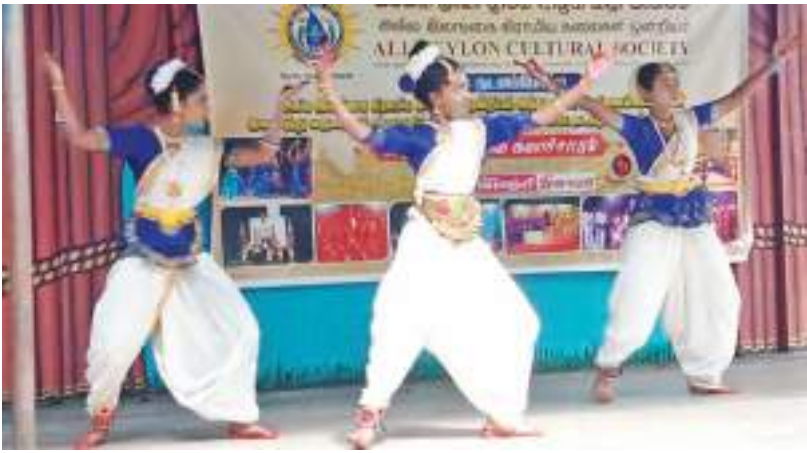
கொழும்பு, கொட்டாஞ்சேனை இந்து மகா வித்தியாலயத்தில் நேற்று முன்தினம் நடைபெற்ற அகில இலங்கை கிராமிய கலைகள் ஒன்றியத்தின் ஆடற்கலைப் போட்டியை ஆரம்பித்து வைத்த சங்கத்தமிழ் இந்து மன்ற அறநெறிப் பாடசாலை மாணவிகளின் நடனம். இந்தப் போட்டி இம்முறை இந்து கலாசார திணைக்களத்துடன் இணைந்து நடத்தப்படுவது குறிப்பிடத்தக்கது.