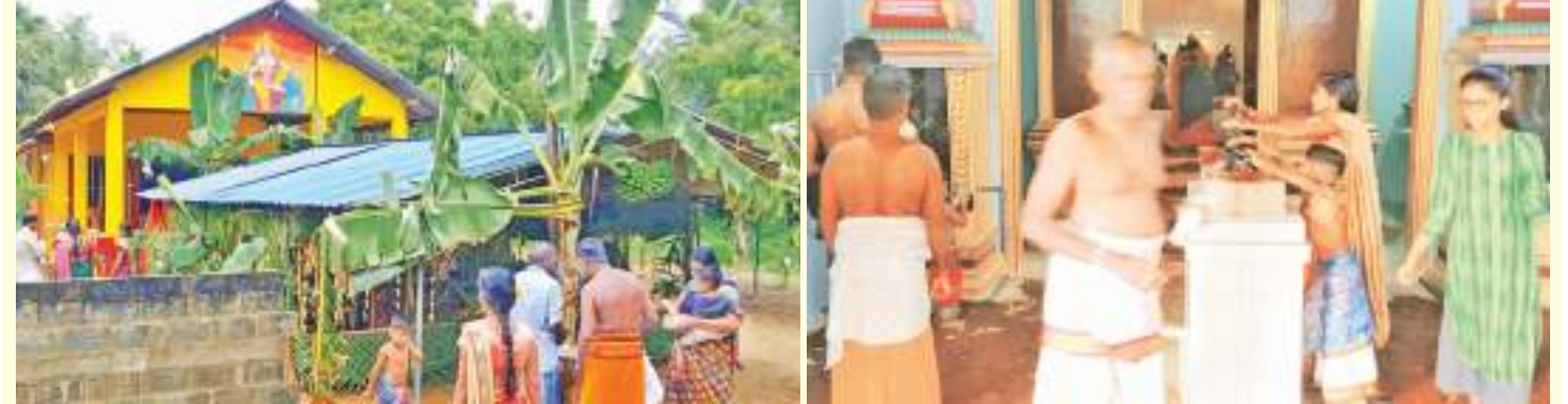
உட்பு, வட்டவான் அருள்மிகு ஸ்ரீ கல்யாண முருகன் ஆலயத்தின் கும்பாபிஷேகத்தை முன்னிட்டு (23) வியாழக்கிழமை எண்ணெய் சாத்தும் நிகழ்வு இடம்பெற்றது. இதன் போது பக்தர்கள் பலர் கலந்துகொண்டனர். (உட்பு குறும்பு நிருபர்)