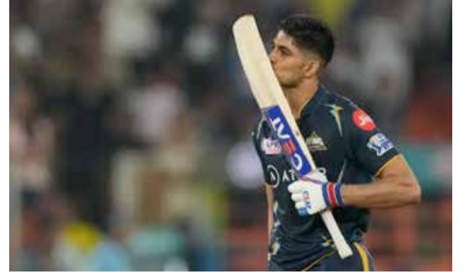
மும்பை, நவ. 29

சகலதுறை வீரர் ஹார்திக் பாண்ட்யா மும்பை இந்தியன்ஸ் அணிக்குச் சென்றதால் ஷஃப்மன் கில் குஜராத் ரைட்டன்ஸ் அணியின் தலைவராக நியமிக்கப்பட்டுள்ளார்.