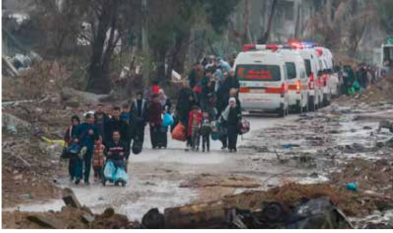
சமூக ஊடகமான எக்ஸ் பதிவில் குறிப்பிட்டிருந்தார்.

இந்த நிலையில் "காலாவட்டாரத்தில் மனிதாபிமான அடிப்படையில் மேலும் இரண்டு நாள் போரை நிறுத்த ஒப்பந்தம் எட்டப்பட்டுள்ளது," என்று கட்டார் வெளியுறவு அமைச்சின் பேச்சாளர் ஒருவர்