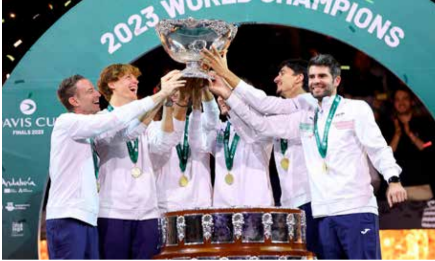
மலாகா, நவ. 29

டேவிஸ் கிண்ண ரென்னிஸ் தொடரில் 47 வருடங்களுக்கு பிறகு சம்பியன் பட்டம் வென்று சாதனை படைத்துள்ளது இத்தாலி அணி.