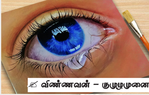
வண்ணவன் - குழுமுனை