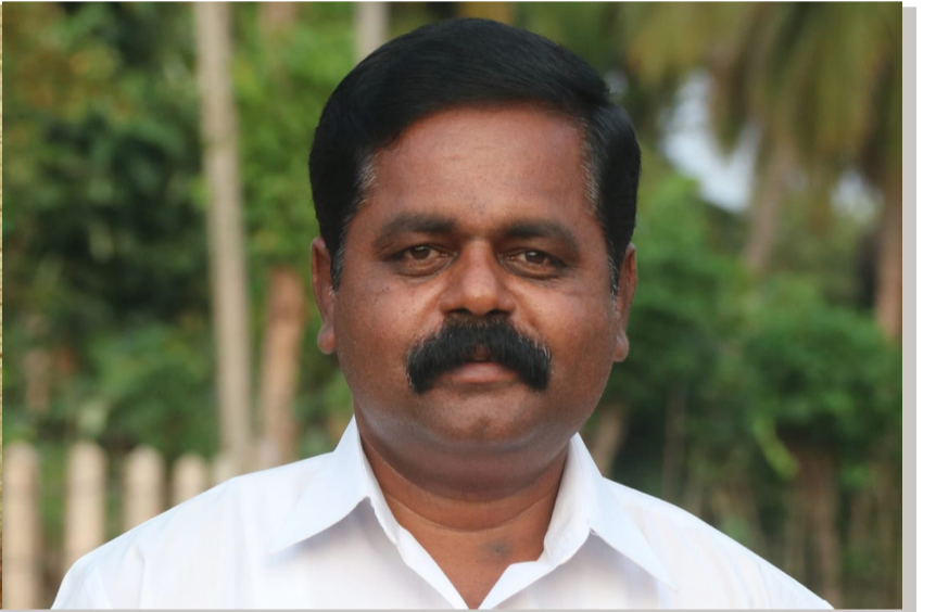
முன்மொழியப்பட்டதால் வாக்கெடுப்பு மூலம் புதிய தலைவரைத் தெரிவு செய்யும் நிலை உருவாகி உள்ளது.... (பக்:02)