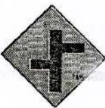
10 முதலாவது பக்க வீதியை கிடப்பக்கமாகக் கொண்டு அடுத்தடுத்து வரும் சந்தி