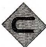
5 முன்னால் வலப்பக்கமாக கொண்டை ஊசி வளைவு