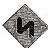
3 முன்னால் கிடப்பக்கமாக கிரட்டை வளைவு