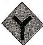
13 முன்று வீதிகளின் சந்தி முன்னால்