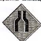
8 வீதி முன்னால் ஒடுங்குகிறது