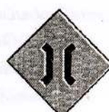
16 ஒடுக்கமான பாலம் முன்னால்