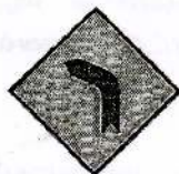
1 முன்னால் கிடப்பக்க வளைவு