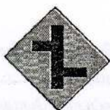
11 முதலாவது பக்க வீதியை வலப்பக்கமாகக் கொண்டு அடுத்தடுத்து வரும் சந்தி