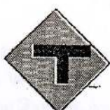
12 'T' சந்தி முன்னால்