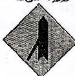
14 கிடமிருந்து வரும் வாகனம் முன்னால் கிணைகிறது