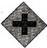
9 முன்னால் குறுக்கு வீதிகள்