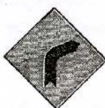
2 முன்னால் வலப்பக்க வளைவு