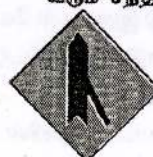
15 வலமிருந்து வரும் வாகனம் முன்னால் கிணைகிறது