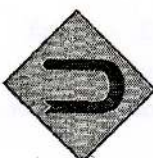
6 முன்னால் கிடப்பக்கமாக கொண்டை ஊசி வளைவு