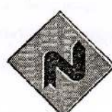
4 முன்னால் வலப்பக்கமாக கிரட்டை வளைவு