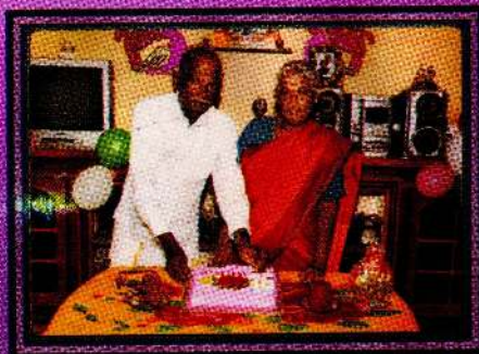
கணவனின் 75வது பிறந்த தினத்தின் போது...