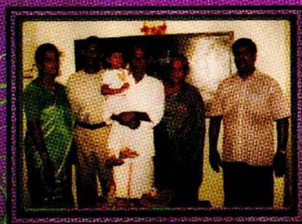
மூத்த வுத்தியின் 3 ம் பிறந்த தினத்தின் போது...