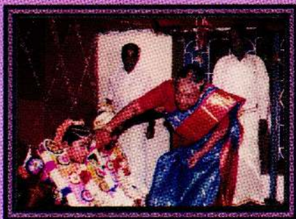
இந்தியாவில் மூத்தமகனின் தருமணத்தின் போது...