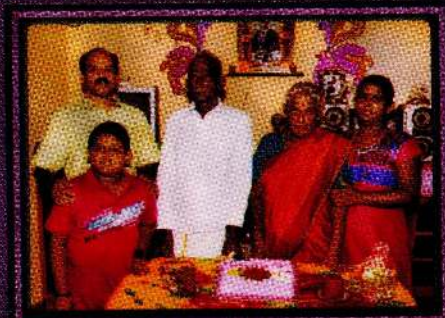
கணவனின் 75வது பிறந்த தினத்தின் போது...