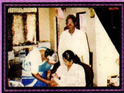
இரண்டாவது மகனின் வருஷாடல் வருதலையில்...