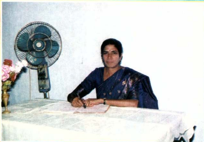
பரமேஸ்வர வித்தியாசாலையில் கடமையின் போது