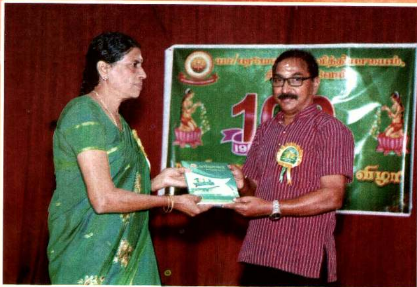
பரமேஸ்வர வித்தியாசாலை பரிசளிப்பு விழாவில் கல்வி அமைச்சருடன்