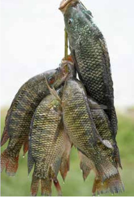
(17ஆம் பக்கத் தொடர்ச்சி)

வேண்டும். ஆகவே முதல் இரண்டு மாதத் திற்கு நீரின் உள். தாமும் தீவனத்தினை கொடுக்காமல் மிதக்கும் தீவனத்தினை மட்டும் கொடுக்க வேண்டும். காரணம் முதல் இரண்டு மாதத்தில் ஏற்படும் மீனின் வளர்ச்சியே அடுத்தடுத்த மாதங்களில் அதிக எடை வைப்பதற்கு உதவியாக இருக்கும்.