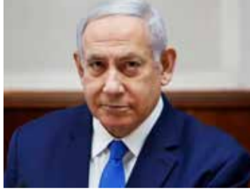
தப்பி ஓடிவிடுவார் என்பதை நாங்கள் அறிவோம். ஆனால் விரைவில் அவரைப் பிடிக்கப் போவது உறுதி என அவர் துள்ளிச் சொன்னார். (அ)