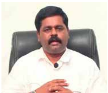
இந்திய வெளியுறவுத்துறை அமைச்சர் ஜெய்சங்கர் மேனனுடன் கலந்துரையாடியதாகவும் அண்மையில் தெரிவித்துள்ளார். இந்தியா தருகின்ற ஒரு ரூபாய், இரண்டு ரூபாயை பெற்றுக் கொண்டு வீடுகளிலேயே இருக்கின்ற சோல்லக்கூடிய அமைச்சர்களால் எப்படி இந்த

இலங்கை கடற்பரப்புக்குள் இந்திய மீனவர்கள் மீன் பிடியில் ஈடுபடுவார்கள் என தெரிவித்ததுடன், அதற்காக இந்தியாவால் இலங்கை மீனவர்களுக்கு பணம் வழங்குவது தொடர்பில்