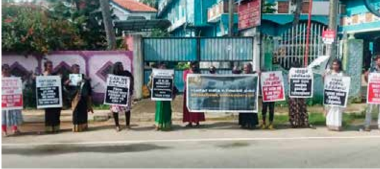
காணாமல் ஆக்கப்பட்டவர்களின் உறவினர்கள் ஊடகங்களுக்கு கருத்து தெரிவித்தது

இதன்போது 'நீதியான சர்வதேச பொறிமுறை விசாரணை தேவை', 'உரிமைகளே இல்லாத நாட்டில் எதற்கு மனித உரிமைகள் தினம்', 'எமது உறவுகள் காணாமல் ஆக்கப்பட்டு பல வருடங்கள் கடக்கின்றது நீதி இல்லை இதனால் எதற்கு இந்த மனித உரிமைகள் தினம்' என