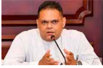
கையை 20 இலட்சமாக உயர்த்தி பொருத்தமானவர்களை தெரிவு செய்ய அரசாங்கம் எதிர்பார்த்துள்ளது. இதற்காக 2024 ஆம் ஆண்டுக்கு 2 ஆயிரத்து 500 கோடி ரூபாய் ரூபாய் நிதி ஒதுக்கப்பட்டுள்ளதாகவும் இராஜாங்க அமைச்சர் செஹான் சேமசிங்க மேலும் தெரிவித்தார்.

பயனாளிகளின் எண்ணிக்கையை 20 இலட்சமாக உயர்த்தி பொருத்தமானவர்களை தெரிவு செய்ய அரசாங்கம் எதிர்பார்த்துள்ளது. இதற்காக 2024 ஆம் ஆண்டுக்கு 2 ஆயிரத்து 500 கோடி ரூபாய் ரூபாய் நிதி ஒதுக்கப்பட்டுள்ளதாகவும் இராஜாங்க அமைச்சர் செஹான் சேமசிங்க மேலும் தெரிவித்தார்.