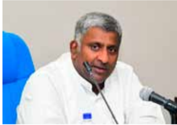
கொழும்பு, டிசெ. 11 கோவிட் தொற்றுநோய் மற்றும் பொருளாதார நெருக்கடி காரணமாக நகர அபிவிருத்தி மற்றும் வீடமைப்பு அமைச்சுக்கு செலுத்த முடியாத 198 கோடியே 97 இலட்சத்து 50 ஆயிரம் ரூபாய் பணம் இந்த மாதம் 31ஆம் திகதிக்கு முன்னர் செலுத்தப்படும் என்று நகர அபிவிருத்தி மற்றும் வீடமைப்பு அமைச்சர் பிரசன்ன ரணதுங்க தெரிவித்துள்ளார்.

இதேவேளை, நிர்மாணத்துறைக்காக தனியான அபிவிருத்தி வங்கியொன்றை நிறுவுவதற்கான யோசனை முன்வைக்கப்பட்டுள்ளது. திறைசேரிக்கு இந்த யோசனை சம்பந்தமாக எண்ணக்கருப் பத்திரம் சமர்ப்பிக்கப்பட்டுள்ளதாகவும், கிடைக்கும் பதில்களின் அடிப்படையில் புதிய வங்கி ஸ்தாபிக்கப்படும் எனவும் அமைச்சர் தெரிவித்தார்.