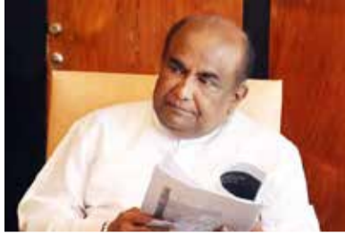
டல்களுக்கு ஆளாக வேண்டியிருக்காது. தற்போது நாட்டில் அனைத்து உணவுப் பொருட்களின் விலைகளும் துரித கதியில் அதிகரித்து செலகிறது - என்றும் சொன்னார். (ஐ)

மேலும், நுகர்வோர் விவகார அதிகார சபையின் அதிகாரத்தை இராணுவத்திடம் ஒப்படைத்தால் மக்கள் இவ்வாறான சுரண்டல்களுக்கு ஆளாக வேண்டியிருக்காது. தற்போது நாட்டில் அனைத்து உணவுப் பொருட்களின் விலைகளும் துரித கதியில் அதிகரித்து செலகிறது - என்றும் சொன்னார். (ஐ)