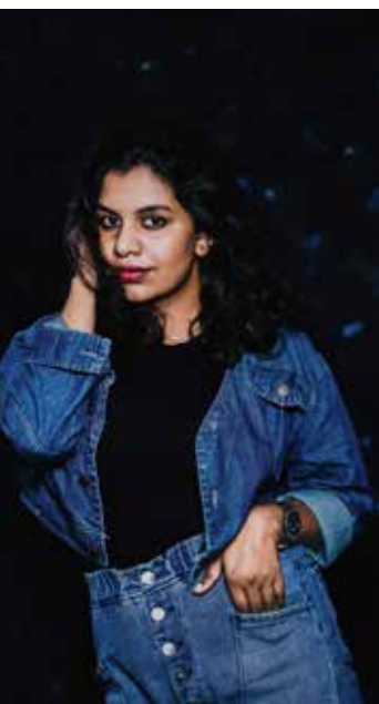
புகைப்படத் துறை சார்ந்த ஆர்வம்

காலவோட்டத்தில் எதிர்காலத்தைப் பற்றிய சிந்தனை