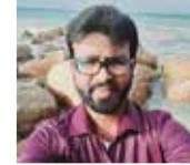
ஆனந்தன் பிரேம்நாந் லக்ஷி பண்ணை

பின்பு மூன்று அடி அகலத்துக்கு மேட்டுப்பாத்தி அமைக்க வேண்டும். பாத்தி