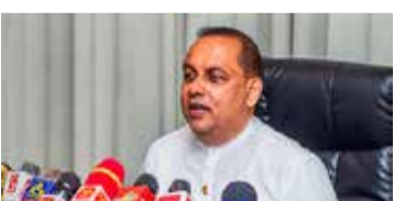
மேற்கொள்ளப்பட்டு வருவதாக விவசாய மற்றும் பெருந்தோட்ட கைத்தொழில் அமைச்சர் மகிந்த அமரவீர தெரிவித்துள்ளார்.

இந்நிலையில் இளநீர் தோட்டங்களை ஒரு பெருந்தோட்ட பயிராக பயிரிடுவதற்கான அனைத்து நடவடிக்கைகளும்