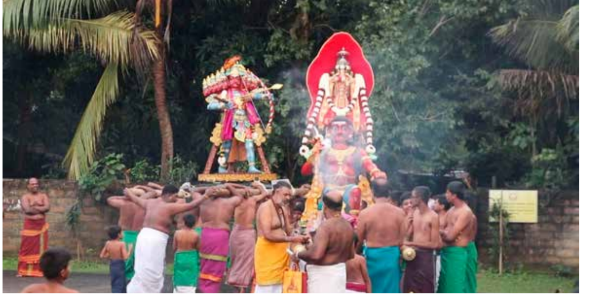
நல்லூர் வடக்கு ஸ்ரீ சந்திரசேகரப்பிள்ளையார் ஆலய கஜமுகாகுர சம்ஹாரம் நேற்று இடம்பெற்ற வேளை...