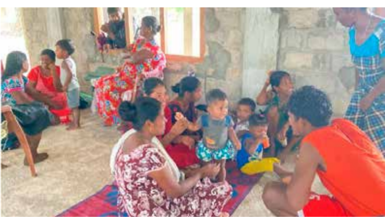
பிரதேசங்கள் வெள்ள அனர்த்தத்துக்கு உள்ளாவதற்கான வாய்ப்பு ஏற்பட்டுள்ளதாக மன்னார் மாவட்ட அனர்த்த