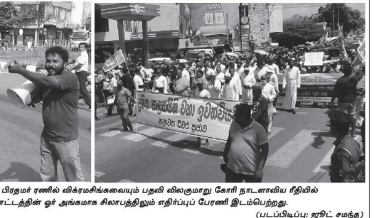
ஊரத்திபி கோட்டிய ராஜபக்ஷையையும் பிரதமர் ரணில் விக்கிரமசிங்கையையும் பதவி விலகுமாறு கோரி நாடளவிய ரீதியில் நேற்றுமுனிமை முன்னெடுக்கப்பட்ட போராட்டத்தின் ஓர் அங்கமாக சிலாபத்தியும் எதிர்ப்பு போரணி இடம்பெற்றது.

இலங்கையில் 72 வரூபுக்கள் பழமமை நிறுவனம் முன்னணி பொது மேற்கொள் நிறுவனமான ஹோமால் இலங்கை பி.எல்.சி. ஓமான் சந்தையில் காலடி எடுத்துவைக்கவுள்ளது. ஓமான் வர்த்தக மற்றும் தொழில்முறை