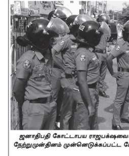
ஊரத்திபி கோட்டிய ராஜபக்ஷையையும் பிரதமர் ரணில் விக்கிரமசிங்கையையும் பதவி விலகுமாறு கோரி நாடளவிய ரீதியில் நேற்றுமுனிமை முன்னெடுக்கப்பட்ட போராட்டத்தின் ஓர் அங்கமாக சிலாபத்தியும் எதிர்ப்பு போரணி இடம்பெற்றது.