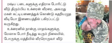
ரஷ்ய படைகளுக்கு எதிராக போரிட்டு வீடு திரும்பிய உக்ரைன் வீரர், அவரது மகன் உட்கூடியணைத்துக் கொண்டு கதறியழுத வீடியோ இணையத்தில் பரவிப்பட்டு வருகிறது.

உக்ரைனின் நாடுக்கு மாதங்களுக்கு முன்பாக போர் நீடித்து வருவது நினைவு, போருக்கு மத்தியில் வீரரொருவர் வீடு