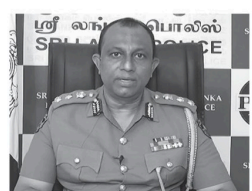
பொலிஸ் ஊடகப் பேச்சாளர் தகவல்