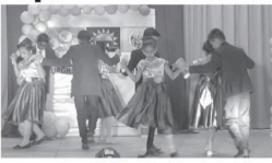
அதிர்வு களைப்பிழைக்க கருணாசிரி கலை நிறுவனத்தினர்

கிழக்கு மாகாண வரலாறு அலுவலகம் திணைக்களம் மட்டக்களப்பு மாவட்டம்