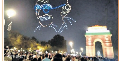
மகாராஜ் சார்ள்ஸின் பிரத்தியேக முன்னிட்டு தலைநகர் டுல்பெர்வைலின் இந்து கோயில் அருகே கன்னகர் டிரோன் கன்னகாட்சி நடைபெற்றது. சந்திரமயம் அவரது வாய்வுடன் பிளீஸிபினைந்த திணைவுகளை எடுத்துக்கூறும் வடிவங்களில் பல வண்ணங்களில் டிரோன்ஸ் பறக்கவிடப்பட்டன.

முன்னதாக, மன்னரை காண நீண்டதூரம் விரிசெய்க நிறுந் நலம் விளாசித் தமக்கள், அவருடன் செல்பி புகைப்படம் எடுத்துக்கொண்டனர்.