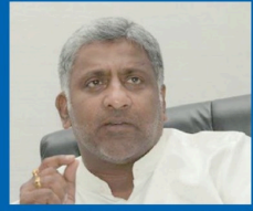
அமைச்சர் பிரசன்ன ரணதுங்க

எந்த நிலையில் இருக்க வேண்டும் என்ற விடயம் எங்களின் வேலைத்திட்டத்தில் இருந்தது. செரோனா நிலைமையினாலும் போர்டுடக்களினாலும் அந்த வேலைத்திட்டங்கள் சீர்குலைந்துவிட்டன. இந்தப் போர்டுட நடவடிக்கைகள் இடம்பெற்ற போதிலும் நாட்டில் நாங்கள் சந்தித்திருந்த பொருளாதார நெருக்கடிக்கு