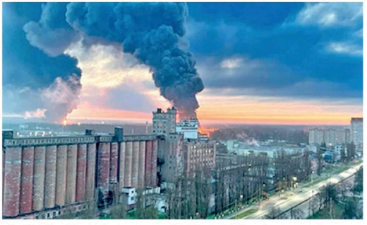
வெற்றியாளிகளின் மையம். மேலும், உக்ரைன் தாக்குதல் தொடர்பில் ரஷ்ய பாதுகாப்பு அமைச்சின் அனுமதியின்றி செய்திகள் வெளியிடக் கூடாதென்ற தடையம் ரஷ்யாவில் உள்ளது. ஆதலால் உண்மை நிலைவரைத் தெரிவித்து சர்வதேச ஊடகங்களுக்கு சுவாகங்கள் ஏற்பட்டுள்ளன. இந்நிலையில், ரஷ்யாவின் ஆயுதக் கிடங்குகள் மீது உக்ரைன் படைகள் தாக்குதல் தொடர்பில் உக்ரைன் உத்தியோகபூர்வமாக அறிவித்துள்ளது. இதன் காரணமாக பெரும் பாதிப்பு ஏற்பட்டுள்ளதாகவும் கட்டிக்காட்டப்பட்டுள்ளது.

உக்ரைனுக்கு மேற்கத்திய நாடுகள் வழங்கிய ஹிமாஸ் என்டெர்ஸ் அதிநவீன ஏவுகணைகள் மூலம் உக்ரைன் இராணுவம் நடத்திய தாக்குதலில் ரஷ்யாவின் 50 ஆயுதக்கிடங்குகளை அழித்துள்ளதாக உக்ரைன் தெரிவித்துள்ளது. எனினும், இந்த விடயத்தை ரஷ்யா முற்றாக மறுத்துள்ளது. உக்ரைனுக்கு ஏதிரை ரஷ்யப் போர் 150 நாட்களை உந்துவிட்ட நிலையில், உக்ரைனின் கிழக்குப் பகுதி நகரங்களை கைப்பற்றும் முயற்சியில் ரஷ்யப் படைகள் தீவிரம் காட்டி வருகின்றன. இந்நிலையில், உயர் தொழில்நுட்பம் கொண்ட அதிநவீன ஏவுகணை அமைப்பான ஹிமாஸ் மூலம் குறிவைத்து உக்ரைன் படை வீரர்கள் நடத்திய பதிலடி தாக்குதலில் ரஷ்யாவின் 50 ஆயுதக்கிடங்கு தகர்ந்துப்பட்டதாக உக்ரைன் பரகாஸ்ப்பு அமைச்சர் தெரிவித்துள்ளார். ரஷ்யாவின் ஆயுதக் கிடங்குகள் மீதான தாக்குதல்களை நடத்துவதற்கு உக்ரைன் இராணுவம் நீண்டகாலமாக முயற்சித்து வந்தது. இதற்கு முன்னரும் பல உட்கவைகள் ரஷ்யா மீது தாக்குதல் நடத்தப்பட்டபோதிலும் அவை குறிப்பிட்டுச் சொன்ன அளவுக்கு