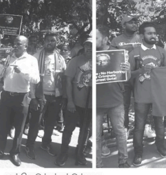
முன்னெடுக்கப்பட்டுள்ளது. இவ்வகையின் இடப்பட்டுகொண்டு வருவானி கோட்டாபய ராஜ்யக்கலை அங்கிருந்து வெளியேற்றி நிதியை மீட்டுவது சிங்கப்பூர் அரசாங்கம் கோட்டாபய