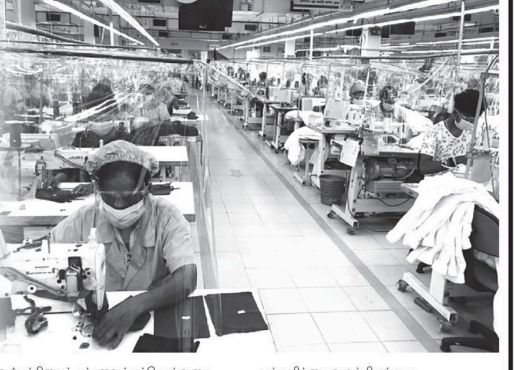
உற்பத்தியைத் தக்கவைத்துக்கொள்வதை உறுதிப்படுத்துதல் தற்போது அன்றாடம் நடவடிக்கைகளில் கடுமையான சவால்களை எதிர்கொள்ளும் தொழிலாளர்களால் முக்கிய பிரிவான சிறிய மற்றும் நடுத்தர அளவிற்கு ஆடை உற்பத்தியாளர்களுக்கான ஆதரவிற்கு முன்னுரிமை அளிப்பது அவசியம் என அவர் தெரிவித்தார். நாடு தற்போது எதிர்கொள்ளும் முன்னெடுக்கப்பட்டுள்ள இவ்வகை நிச்சயமற்ற நிலை, சுற்றிநிற உலகமாவிய சந்தை நிலைமைகள் மற்றும் அதிகரித்து வரும் முலப்பொருட்கள் மற்றும் உற்பத்திக்கான செலவுகள் மேலும் உறுதிப்படுத்தும் இவ்வகையின் ஆடைத் தொழில்துறையானது தேசிய பொருளாதாரத்தில் குறிப்பிடத்தக்க