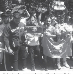
சிங்கப்பூர் அரசாங்கம் இவ்வகையின் முன்னர் ஊழல்தீய கோட்டாபய ராஜ்யக்கலை அங்கிருந்து வெளியேற்ற வேண்டும் எனக்கோரி பிரித்தானியாவில் அமைந்துள்ள சிங்கப்பூர் துறைமுகத்தில் முகாம்கொண்டவர்கள் தமது செயற்பாட்டாளர்களால் ஆர்ப்பாட்டம் ஒன்று