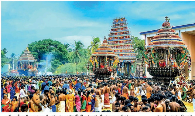
நயினாதீவு ஸ்ரீ நாகபூஷணி அம்மன் ஆலய இரதேர்தலில் நேற்று நடைபெற்றது.

மலர் : 03, இதழ் : 16 சுபகிருது வருடம், ஆனி மாதம் 29ஆம் திகதி புதன்கிழமை (13.07.2022) ஹரிஜி - 1443, துலாஜி - 13, 011586187 - பக்கங்கள் 12 வீரல் ரூ.50