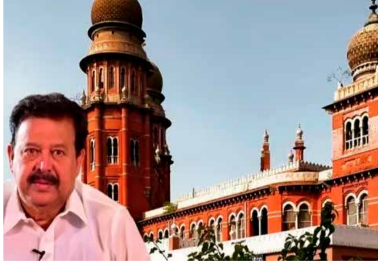
மேலும், இலஞ்ச ஒழிப்பு பொலிஸார் வழக்கில் சுமத்தியுள்ள குற்றச்சாட்டுக்கள் நிரூபிக்கப்பட்டுள்ளன. அதனால், அவர்களை விடுதலை செய்து சிறப்பு நீதிமன்றம்