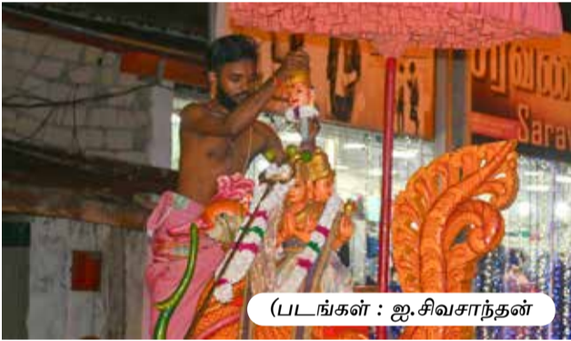
(படங்கள் : ஐ. சிவசாந்தன்)