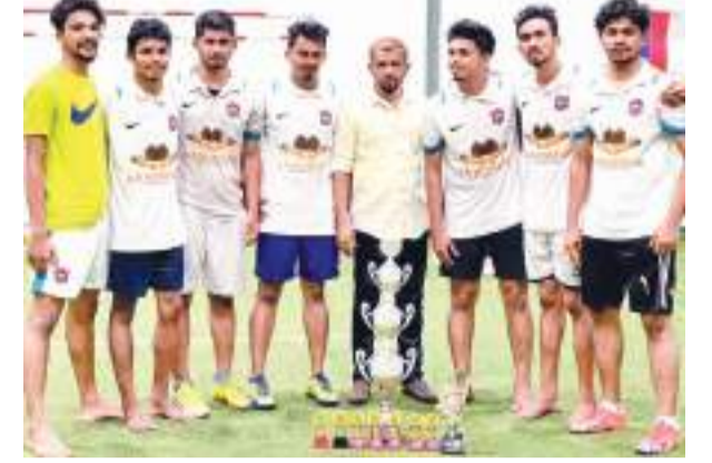
ஒலுவில் கிழக்கு தினகரன் நிருபர்