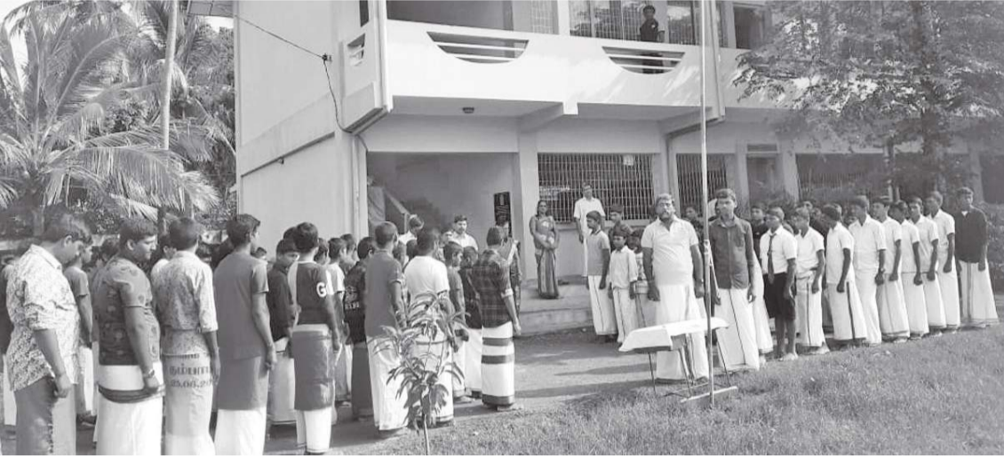
போதையற்ற நேர் சிந்தையுடைய ஆன்மீகம் சார் மற்றும் அறம்சார் இளம் சந்ததிகளை உருவாக்கும் நோக்கில் இப்பயிற்சி நெறிகள் ஆரம்பிக்கப்பட்டுள்ளன.

மாணவர்களுக்கான சிவதொண்டர் வதிவிட பயிற்சி நெறிகள் கடந்த சனிக்கிழமை (23) ஆம் திகதி ஆரம்பமானது. அகில இலங்கை சைவ மகா சபையின் பொது செயலாளர் மருத்துவர் பரா நந்தகுமார் தலைமையில் ஆரம்பமானது. வட்டு, இந்துக் கல்லூரியில் தரம் 8 மற்றும் தரம் 9 இல் கல்வி கற்கும் மாணவர்களுக்காக இந்த வதிவிட பயிற்சி நெறிகள் ஆரம்பிக்கப்பட்டுள்ளன. வலிகாமம் மற்றும் தீவக கல்வி வலயங்களில் ஒத்துழைப்புடன் அகில இலங்கை சைவ மகா சபை, இந்த பயிற்சி நெறிகளை வழங்கவுள்ளது.