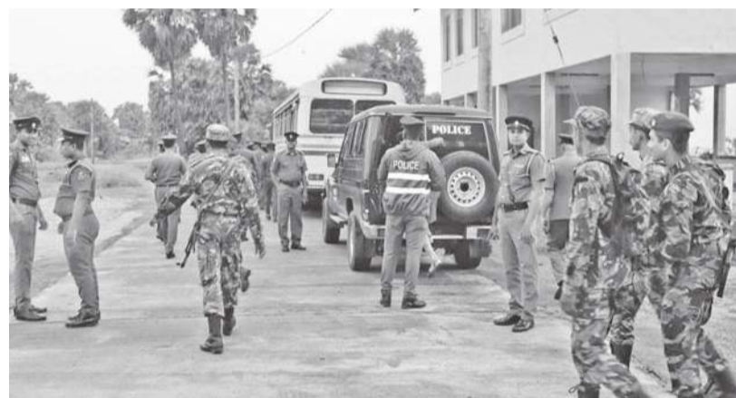
பாவனை மற்றும் விற்பனைகளைத் தடுக்கும் வகையில் "யுக்திய" விசேட இராணுவ நடவடிக்கைகள் முன்னெடுக்கப்பட்டு வருகின்றன. இதற்கிணங்கவே முல்லைத்தீவு மாவட்டத்திலும் இந்த சுற்றிவளைப்புக்கள் முன்னெடுக்கப்பட்டன.

முல்லைத்தீவு மாவட்டத்தில் ஏழு தினங்கள் மேற்கொள்ளப்பட்ட சுற்றிவளைப்புக்களில், 250 பேர் கைதாகியுள்ளனர். இவர்களில், 113 பேர், போதைப்பாவனையாளர்களாவர். இதில், 25 பேர் புனர்வாழ்வு நிலையங்களுக்கு அனுப்பி வைக்கப்பட்டுள்ளனர். இச்சுற்றி வளைப்புக்கள் கடந்த 17 முதல் 24 வரை மேற்கொள்ளப்பட்டிருந்தன. பொலிஸார், பொலிஸ் விசேட அதிகாரிகளின் தலைமையில், இராணுவத்தினர் இணைந்து இவ்விசேட சுற்றிவளைப்பு நடவடிக்கைகளை முன்னெடுத்தனர். நாடளவிய ரீதியில் போதைவஸ்து