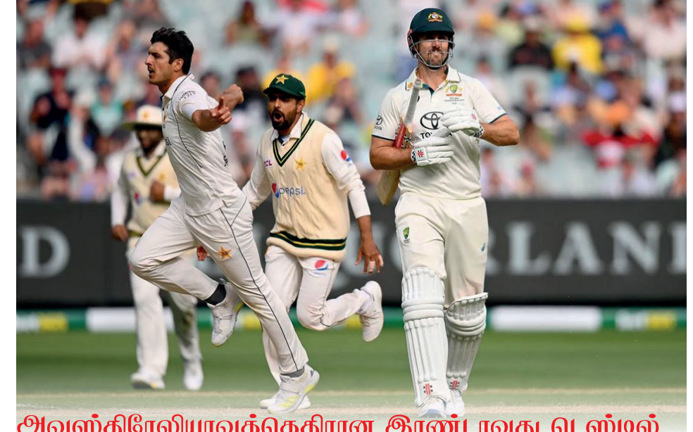
அவுஸ்திரேலியாவிற்கெதிரான இரண்டாவது டெஸ்டில்