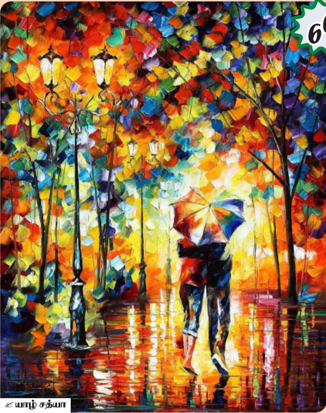
ஊ யாழ் சத்யா

அருண்யாவை சங்கடத்தில் ஆழ்த்திய விடயம் ஆங்காங்கே புற தரைகளிலும் விசிறி வாழை மறைவுக